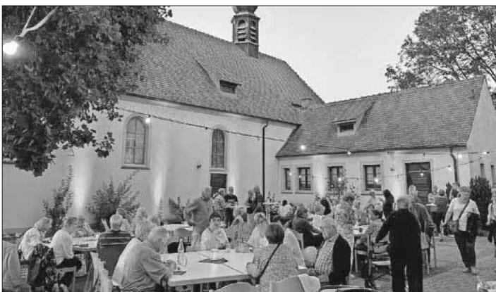
Das Lichterfest im Hof von St. Marien in Köndringen war gut besucht.

Ob drinnen oder draußen: Die Anwesenden verschiedener Generationen genossen die schöne Atmosphäre. Das Gemeindeteam St. Gallus hatte das Lichterfest organisiert und freute sich über die gute Resonanz. Ein herzlicher Dank an die Helferinnen und Helfer, die zum Gelingen beigetragen haben!