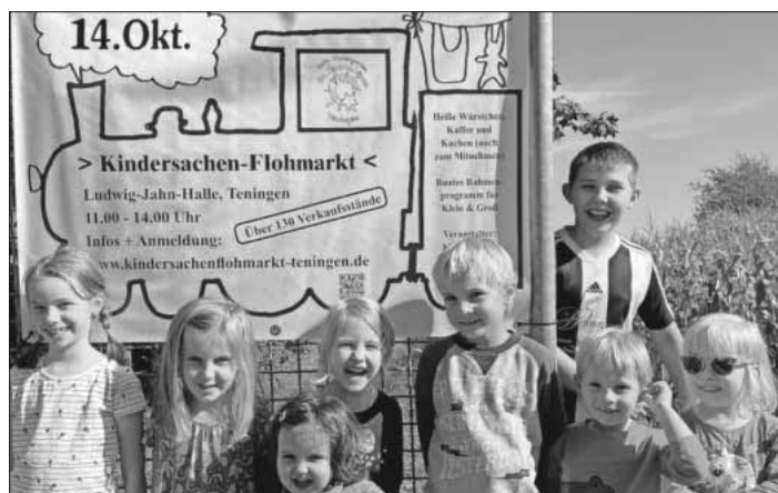
Die Werbebanner wurden unter tatkräftiger Mithilfe der Kinder an den Ortseingängen aufgehängt.

Der gesamte Erlös kommt den Projekten des St.-Franziskus-Kindergartens zugute. Weitere Informationen gibt es auf der Homepage unter www.kindersachenflohmarkt-teningen.de .