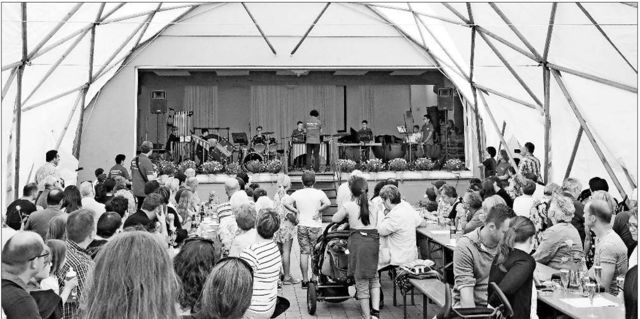
Die Percussionsschüler mit beeindruckender Performance.

chester. Unter dem zahlreichen Applaus des Publikums zeigten danach das MusikNest und die musikalische Früherziehung, was man mit kleinen Kindern musikalisch bewegen kann. Rhythmus-, Blockflöten – und Klavierkinder gaben danach Einblicke in die nächste Liga der musikalischen Betätigung. Was dann folgerichtig zum größten Part der Vorführungen überging. Die Jugendlichen an den Instrumenten des Orchesters begeisterten in Einzel- und Gruppenvorträgen die Gäste. Aus dieser Gruppe konnten 13 begabten Schülerinnen und Schülern die Auszeichnung zum „Jungmusikerleistungsabzeichen Junior“ übergeben werden. Das Jugendorchester beendete dann den hoffentlich für alle Beteiligten in toller Erinnerung bleibende Kinder- und Jugendummittag 2017. Die Winzerkapelle bedankt sich für beide Tage bei den Anwohnern für ihr Verständnis.