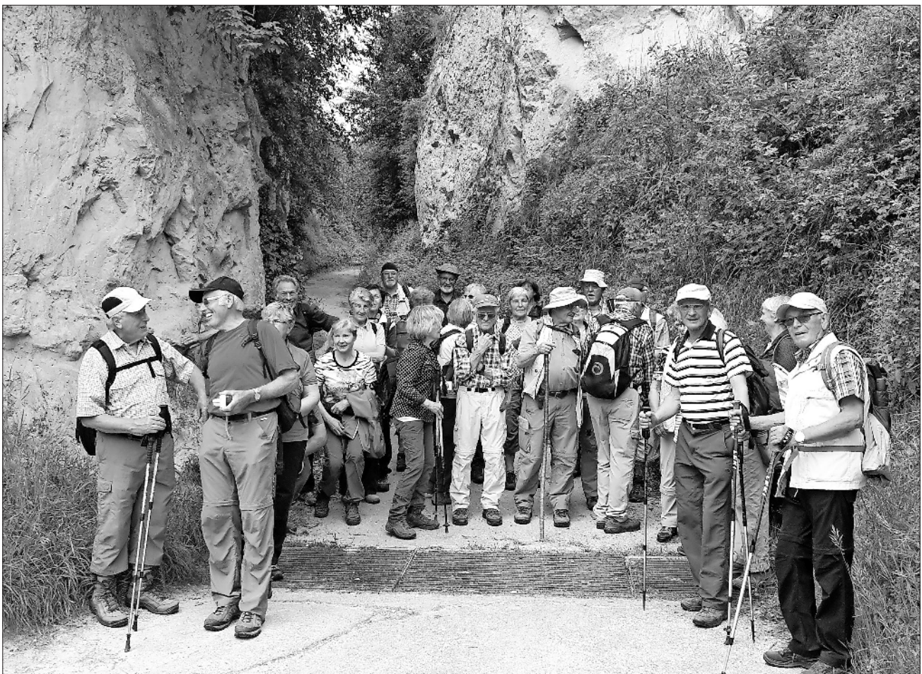
Die Teninger Wandergruppe.

Danach führte der Weg über den Käseberg nach Bischoffingen, wo der Bus die Wanderer abholte und alle zufrieden und mit nachhaltigen schönen Eindrücken versehen wieder nach Teningen brachte. Insgesamt hatten die Wanderer 13 Kilometer in 4,5 Stunden zurückgelegt.