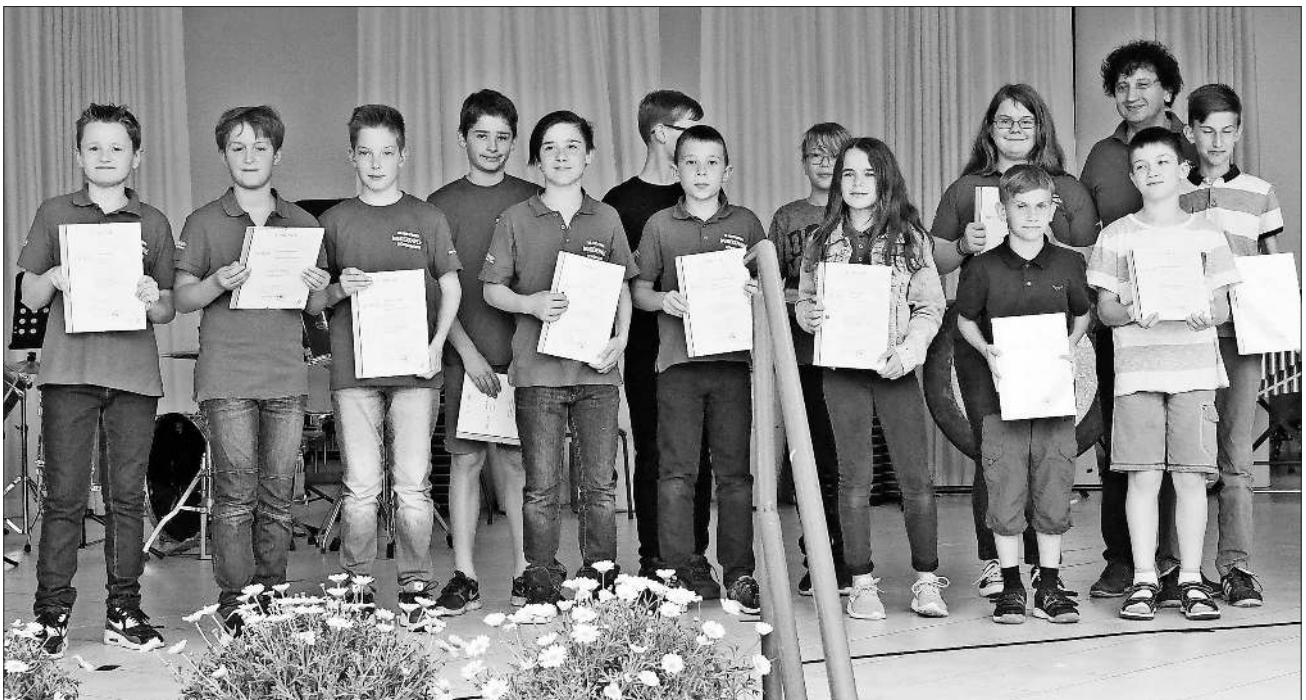
Dreizehn Mal gab es das Jungmusikerleistungsabzeichen Junior.