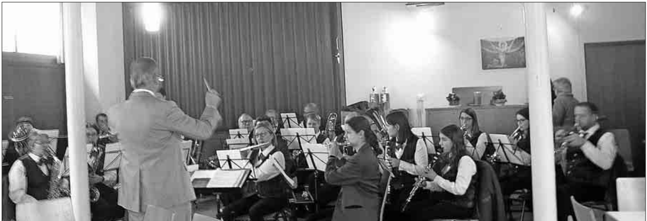
Der Musikverein Nimburg-Bottingen, der den Gemeindegottesdienst musikalisch umrahmte.

Mitentscheiden und sehen, wo Ihr Geld wächst!