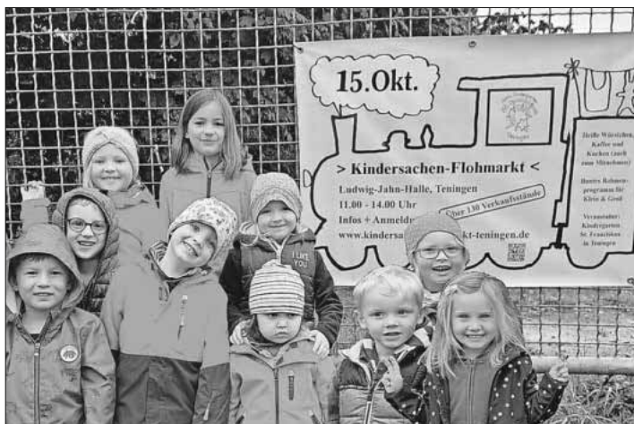
Die Kinder freuen sich schon auf den Flohmarkt.

Für die Aussteller und Besucher stehen reichlich Parkplätze rund um die Ludwig-Jahn-Halle zur Verfügung. Der Kindergarten St. Franziskus lädt alle, die gerne feilschen und stöbern, zum Flohmarkt-Bummel und gemütlichen Verweilen ein. Auch wer sich nur mit Kuchen fürs Wochenende eindecken möchte, ist herzlich willkommen. Sämtliche Einnahmen kommen zu 100 Prozent den Projekten des Kindergartens St. Franziskus und somit den Kindern zugute.