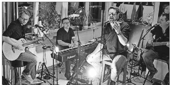
Für gute Stimmung ist mit Livemusik gesorgt.