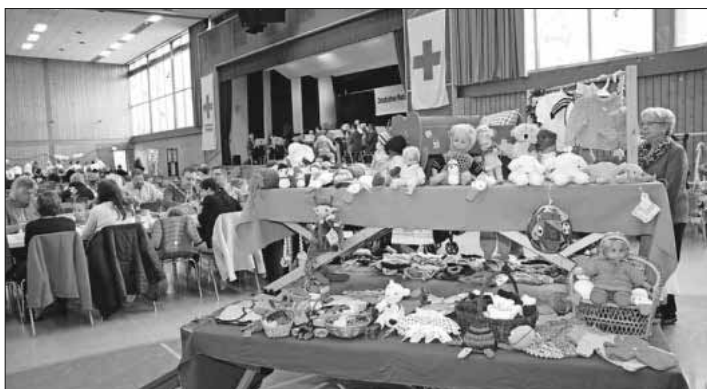
Große Auswahl im Warenkorb des Rotkreuz-Basar.

Nach dem DRK-Motto „Menschen helfen, Gesellschaft gestalten“ will das DRK den Wohltätigkeitsbasar nun wieder zum Erfolg werden lassen, um den Erlös der Veranstaltung einem wohltätigen Zweck zukommen lassen. Deshalb freut sich das Deutsche Rote Kreuz, Ortsverein Teningen, darüber, seinen Besuchern einen schönen Tag am 1. November bereiten zu können. „Aus Liebe zum Menschen.“