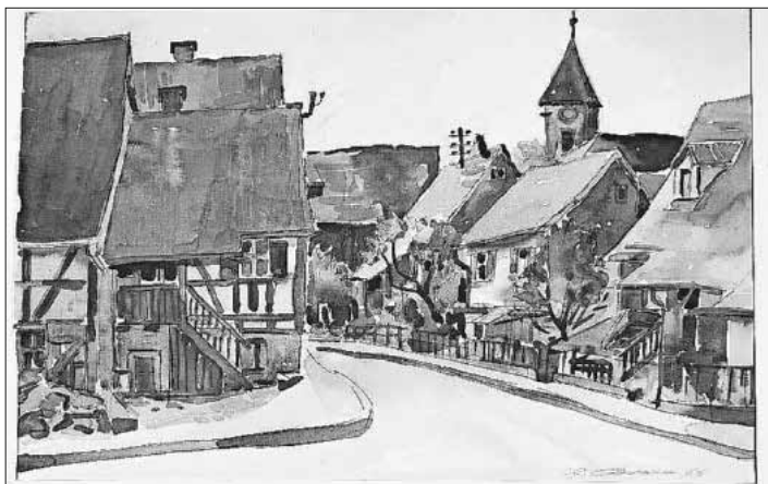
Bild eines Künstlers von einer früheren Ausstellung

Die Öffnungszeiten der Ausstellung sind am Samstag / Sonntag, sowie am Dienstag, 1. 11. (Allerheiligen), von 10 bis 18 Uhr, an den Werktagen von 15 bis 18 Uhr. Angesichts des regen Interesses und Erfolges bei den früheren Teningen Kunstausstellungen freuen sich die beteiligten Kunstschaffenden und die Verantwortlichen des Kulturvereins wieder auf viele Besucherinnen und Besucher.