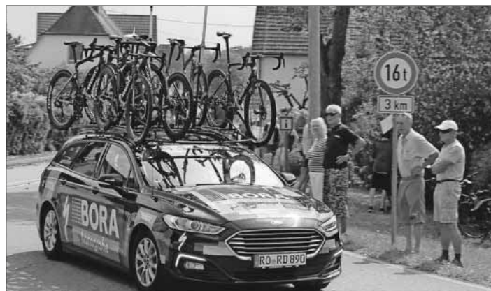
Ein Blickpunkt waren die zahlreichen Begleitfahrzeuge mit Ersatzrädern, hier das Fahrzeug des deutschen Rennstalls Bora-Hansgrohe. Deren Kapitän Emanuel Buchmann landete am Ende auf dem 16. Platz mit einem Rückstand von fast drei Minuten zum Gesamtsieger Adam Yates.