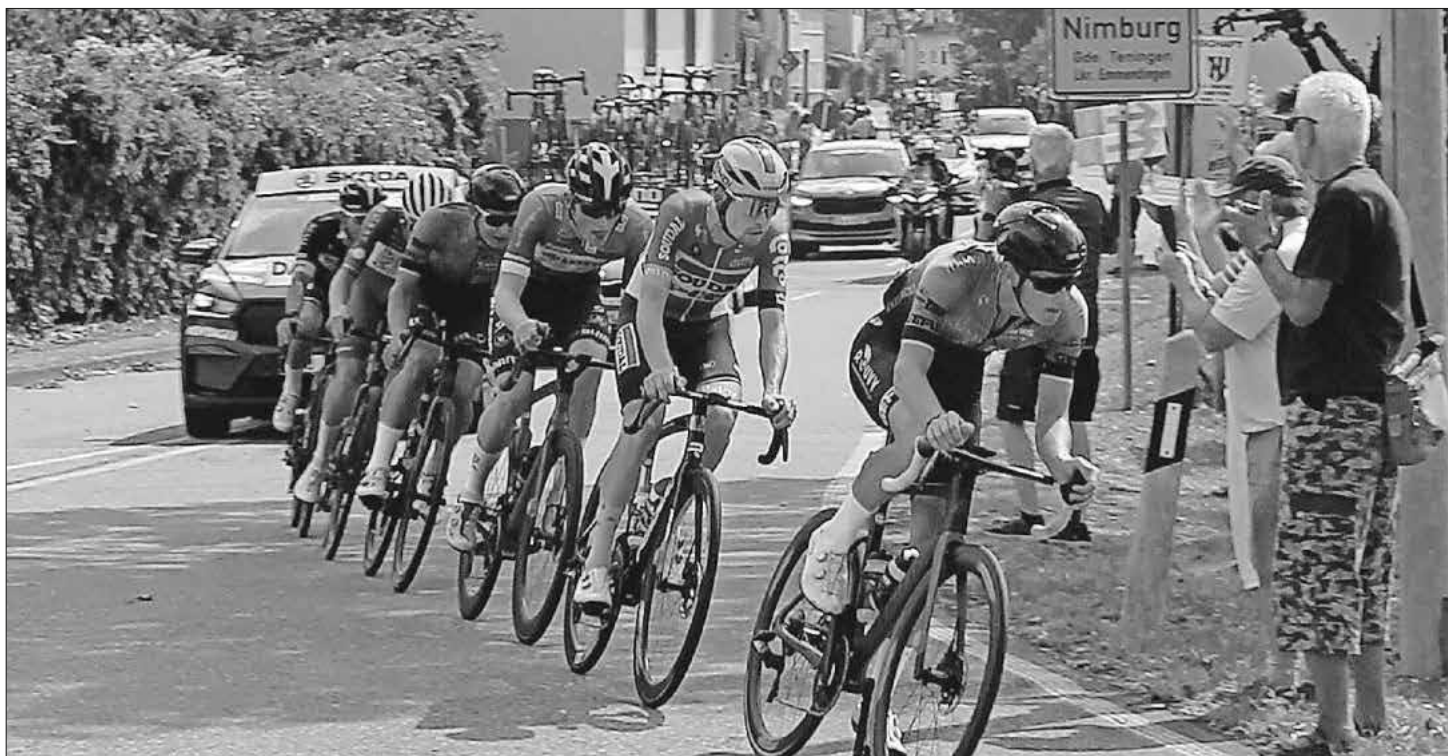
Früh bildete sich eine sechsköpfige Ausreißergruppe.