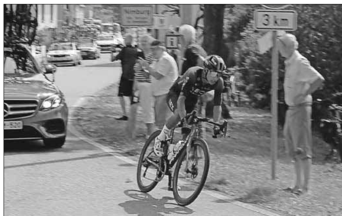
Der letzte Fahrer in Nimburg ist zugleich einer der bekanntesten Radsportler: Egan Bernal. Der 25-jährige Kolumbianer gewann 2019 die Tour de France. Er nutzte die Deutschland Tour nach einem schlimmen Unfall im Januar zu Trainingszwecken und beendete die Etappe als 74.