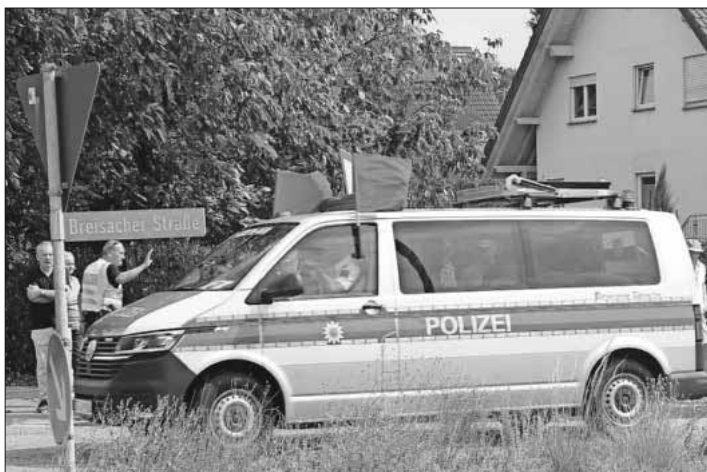
Polizeifahrzeug mit roten Flaggen: Ab jetzt gelten die Straßen offiziell als Veranstaltungsfläche und die Strecke ist durch die Posten anhand von Absperrgittern zu sperren.