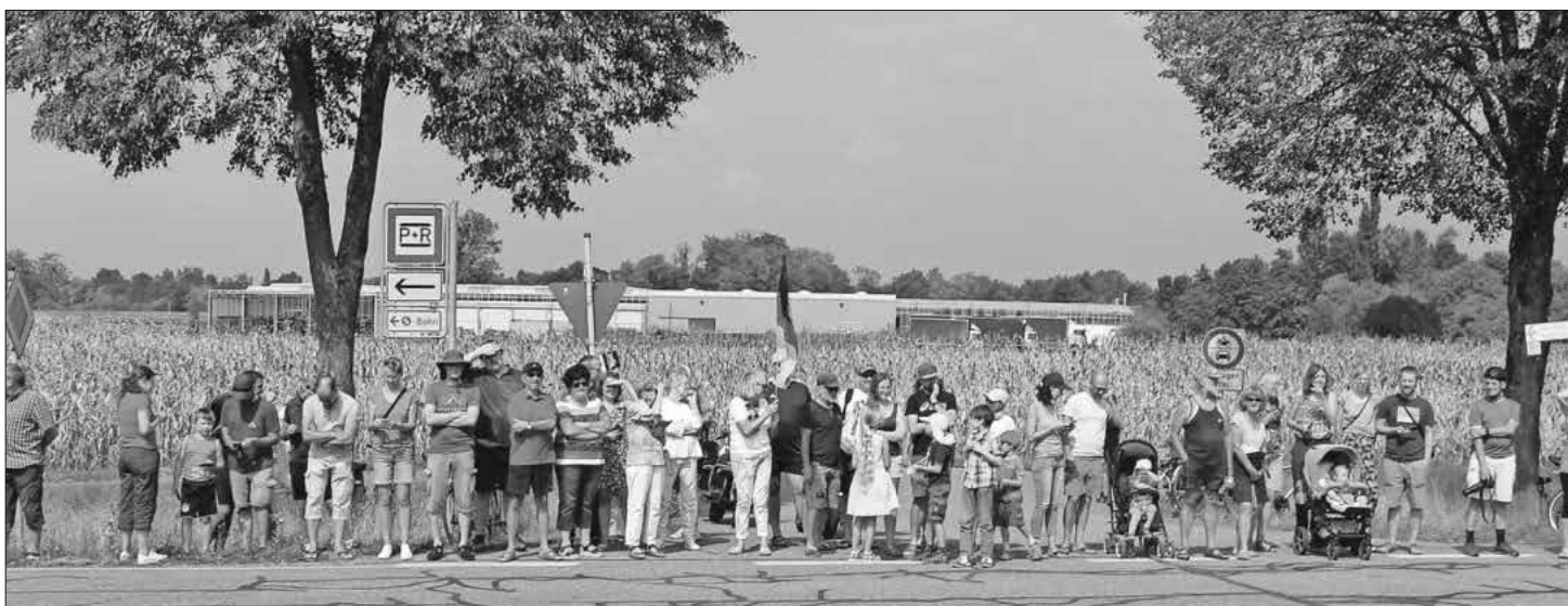
Zahlreiche Zuschauerinnen und Zuschauer säumten die Rennstrecke. Vor allem an der L 114, wo die Fahrer eine Neunzig-Grad-Kurve zu bewältigen hatten, war richtig Betrieb.

Die Breisgau-Etappe und auch die Tour gewann im Übrigen der Brite Adam Yates vom Team Ineos Grenadiers.