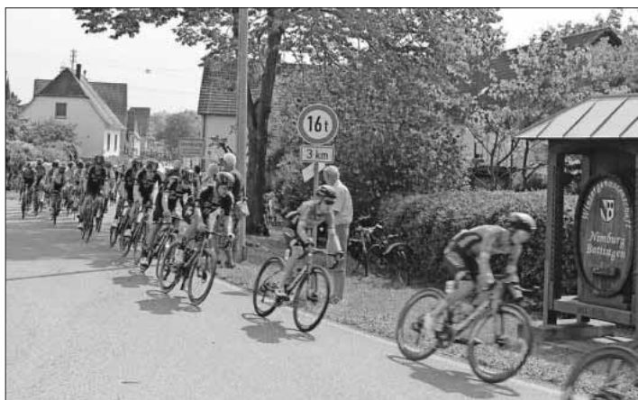
Bereits fünf Minuten Rückstand auf die Ausreißergruppe hatte das Peloton in Nimburg.