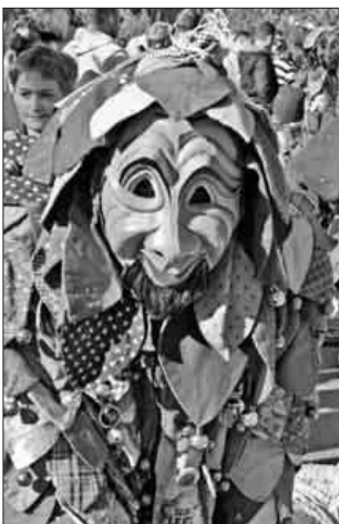
Mit viel Spaß dabei die Däninger Dübbageischder.

Mit schmetternden Rhythmen von Trompeten und Fanfaren allen voran der Fanfarenzug Teningen. Im Schlepptau eine närrisch wild aufbrausende riesige Menge Ruäbsäck, gefolgt von über 123 weiteren Narren- und Musikgruppen. Tausende fröhlich gestimmte Akteure aus der näheren Region aber auch aus dem schwäbischen, der Ortenau, vom Oberrhein aus dem Schwarzwald und vom Bodensee, sorgten entlang der Umzugsstrecke für ein buntes stimmungsvolles Treiben. Im Nu sprang der närrische Funke über und die Zuschauer ließen sich nicht lange bitten, sich am närrischen Spektakel zu beteiligen. Eine Bombenstimmung, da konnte es schon mal den einen oder anderen Zuschauer erwischen mit einer reichlichen Konfettidusche. Fasnacht ist eben auch Konfetti für die Sinne, ob das die oftmals jungen Mädchen auch so sahen, sei mal dahingestellt, jedenfalls hatten sie ihren Spaß dabei. Hästräger, die immer wieder ihren Schabernack trieben, tobend-tänzelnde Hexen, Teufel, Schelme und andere bunt kostümierte Narren sorgten zur passenden Begleitmusik der Guggemusiken und Spielmannszügen für reichlich buntes und stimmungsvolles Treiben.