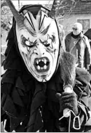
Sehen schlimmer aus als sie sind, die Elz-Bieschder.