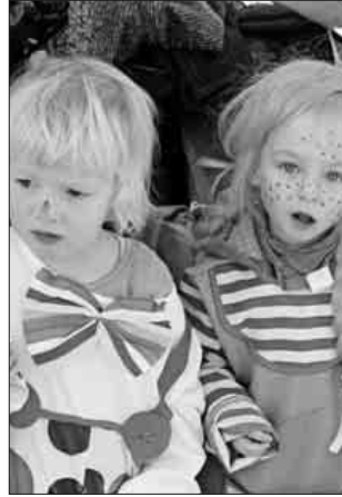
Auch den Kindern hat der Umzug Spaß gemacht.

ein Großteil der Narren beim 30-jährigen Jubiläumsabend im Narrendorf und der Winzerhalle kräftig mitgefeiert. Der Auftakt des Umzug-Sonntags bildete ein Fastnachtsgottesdienst in der evangelischen Kirche Köndringen und anschließend fand der zu diesem Anlass übliche Zunftmeisterempfang statt. Punkt 13.31 Uhr setzte sich der närrische Lindwurm ausgehend von der Gartenstraße in die Heimbacher Straße, über die Hauptstraße (B3) in die Bahnhofsstraße und letztendlich in die Tschulinstraße bis zur Winzerhalle in Bewegung.