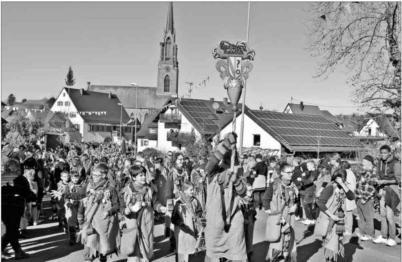
Der Umzug beginnt.

hand. Zum Jubiläumsumzug am Sonntag strömten 123 Narren- und Musikgruppen in ihren traditionellen Kostümen und Masken aus der nahen und auch weiteren Region nach Köndringen. Ob Hexen, Geister, Teufel, Dämonen, Wieber oder wie in diesem Fall jede Menge Ruäbsäcke, alle sorgten am Jubiläumswochenende für reichlich närrisches Treiben. 30 Jahre Kindringer Ruäbsäck, da braucht man schon eine gehörige Portion närrische Kondition. Bereits am Samstagabend hatte