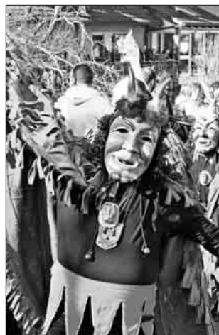
Die Heimbacher Waldteufel feierten kräftig mit.