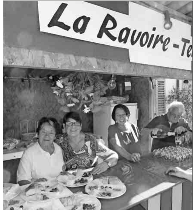
Immer dabei: der deutsch-französische Verein mit Käse und Wein aus der Partnerstadt La Ravoire.