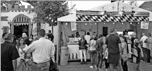
Viel Mühe gaben sich auch diesmal wieder die teilnehmenden Vereine. Hier das alte Waaghaus, umgestaltet durch den Fanfarenzug.