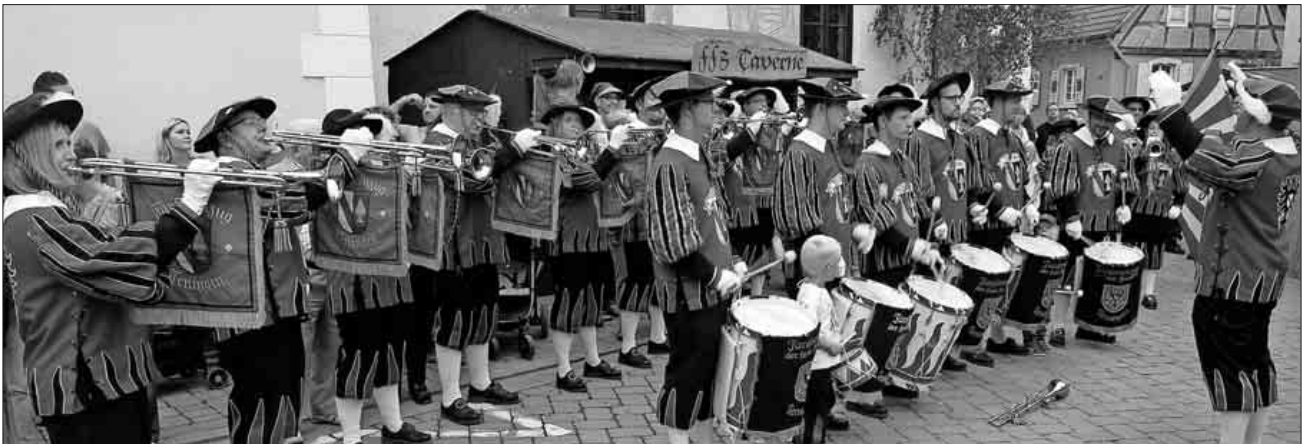
Beim 24. Teninger Gassenfest waren Festgäste genauso zufrieden wie Festvereine, bei herrlichem Spätsommerwetter kamen alle auf ihre Kosten. Eröffnet wurde es der Tradition entsprechend durch den Teninger Fanfarenzug.