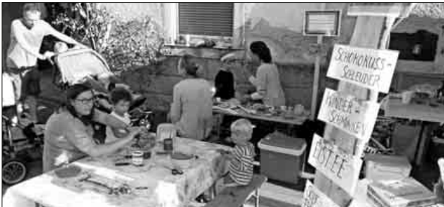
Beim Waldkindergarten konnten die Kinder das Gassenfest auf ihre Art genießen.