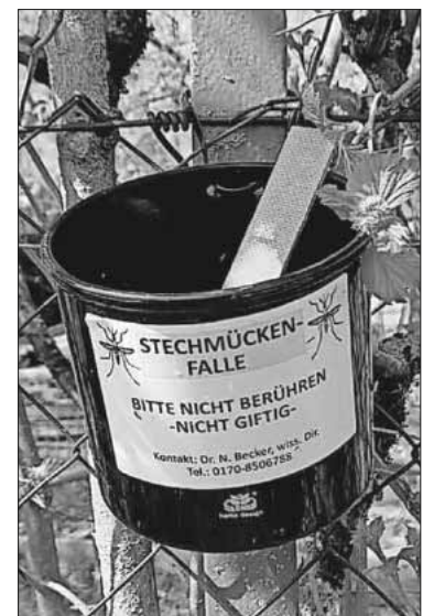
Foto einer Stechmückenfalle.

In der Gemeinde kann man bei genauerem Hinsehen Stechmückenfallen entdecken. Die schwarzen Plastikbehälter, die an Zäunen, Laternenpfählen und Bäumen befestigt werden, enthalten nur etwa einen Liter Wasser und einen Holzstab. Sie sind also völlig ungiftig und imitieren natürliche Brutstätten von containerbrütenden Stechmückenarten, wie zum Beispiel der Asiatischen Tigermücke oder der Japanischen Buschmücke. Die graviden (schwangeren) Weibchen, angelockt vom Wasser in der Falle, legen ihre Eier auf den Holzstäbchen ab. Die Stäbchen werden von der Firma ICYBAC- biologische Bekämpfung regelmäßig abgeerntet und auf Stechmückeneier untersucht. So kann herausgefunden werden, wo die Tiger- und Buschmücken vorkommen und in welcher Zahl. Auf Grundlage dieser Erkenntnisse kann dann gezielt gegen diese Populationen vorgegangen werden. Die Stechmückenfallen werden bis Ende September in der Gemeinde zu finden sein.