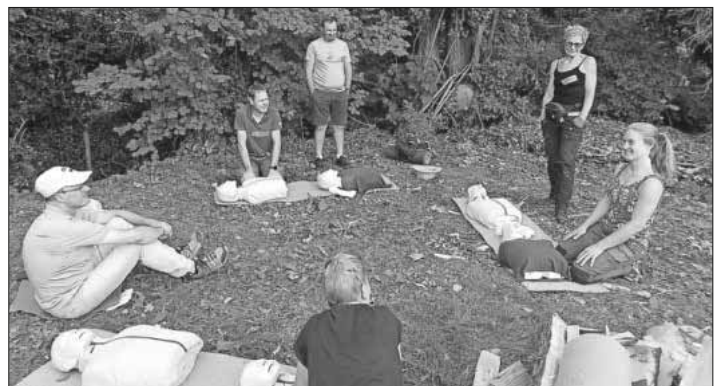
Angeleitet von der Outdoorschule Süd übten die Teilnehmenden die Herz-Lungen-Wiederbelebung.

Auch im kommenden Jubiläumsjahr 2024 – der Schwarzwaldverein feiert seinen 50. Geburtstag – wird wieder ein interessantes und abwechslungsreiches Wanderprogramm in Schwarzwald, Kaiserstuhl und Vogesen geboten. Die Planungen sind bereits in vollem Gange. Wie üblich werden die Termine über die Homepage ( www.schwarzwaldverein-teningen.de ) und die Teninger Nachrichten bekannt gegeben. Mitglieder erhalten den Wanderplan nach Erscheinen.