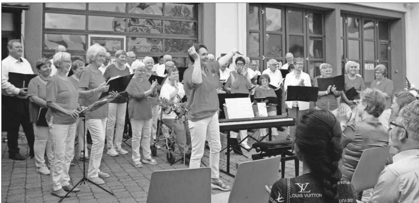
Männerchor und Herzdamen des Köndringer Gesangvereins eröffneten das dritte Zehnthofkonzert.