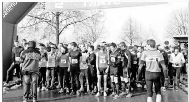
Kurz vor dem Start zum 10-km-Lauf.

Ein herzliches Dankeschön für die Unterstützung bei der Durchführung des 25. Allmendlaufes geht vom Organisationsteam der TuS-Leichtathleten an die Freiwillige Feuerwehr Teningen, an das Deutsche Rote Kreuz aus Teningen, die Gemeinde Teningen mit Bauhof und Gemeindeverwaltung und an alle Eltern und vielen Helfer aus der Leichtathletikabteilung des TuS Teningen.