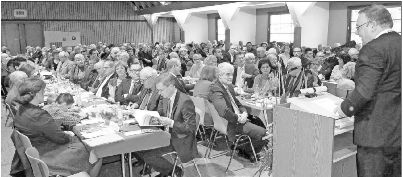
Bürgermeister Heinz-Rudolf Hagenacker bei der Ansprache in der voll besetzten Winzerhalle.