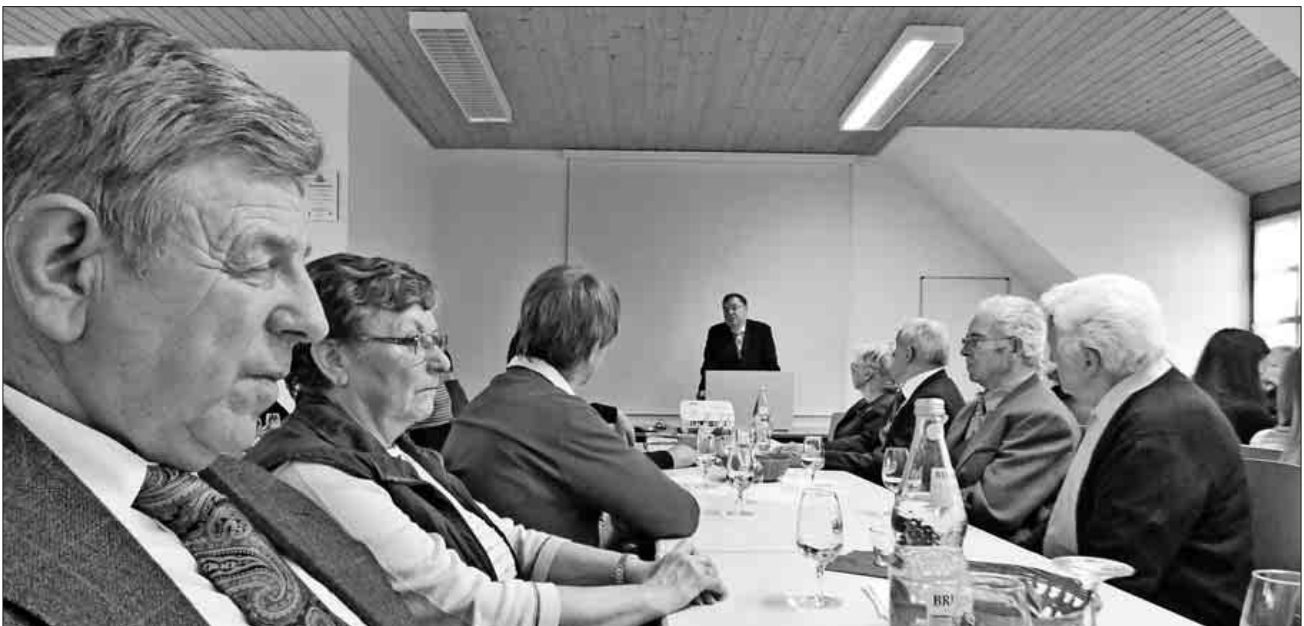
Bürgermeister Heinz-Rudolf Hagenacker stellt die Zukunftspläne vor.

Die Gesamtgemeinde verfügt über viele Gebäude, die zwischen 50 und 60 Jahre alt sind und somit nicht mehr der heutigen Infrastruktur entsprechen und saniert werden müssen. Eine große Herausforderung für die Gemeinde, so Hagenacker, die zudem auch noch damit zu kämpfen hat, dass die Kommunen in diesem Jahr nicht umfassend berücksichtigt wurden.