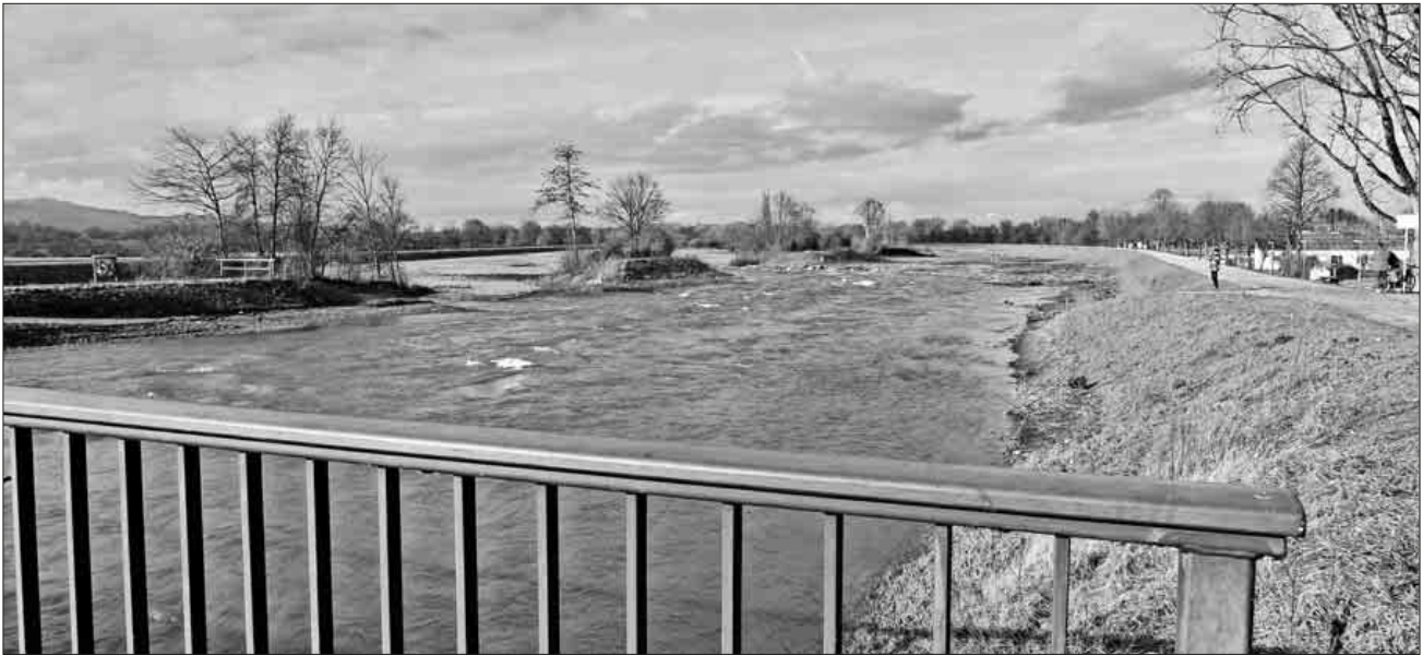
Von der Köndringer Elzbrücke aus hat man einen schönen Überblick.

Gleichzeitig belebt man wieder längst zerstörte Lebensräume für Flora und Fauna. Der Naturliebhaber kann hier eine sich ständig wechselnde Flusslandschaft im ständigen Wandel beobachten, sei es während der trockenen Sommermonate oder wie jetzt mit den Überflutungsflächen.