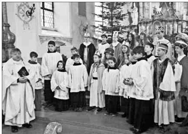
Die Sternsinger 2018

Ebenso ein Vergelt's Gott allen Helfern und Organisatoren der Sternsinger-Aktion 2018.