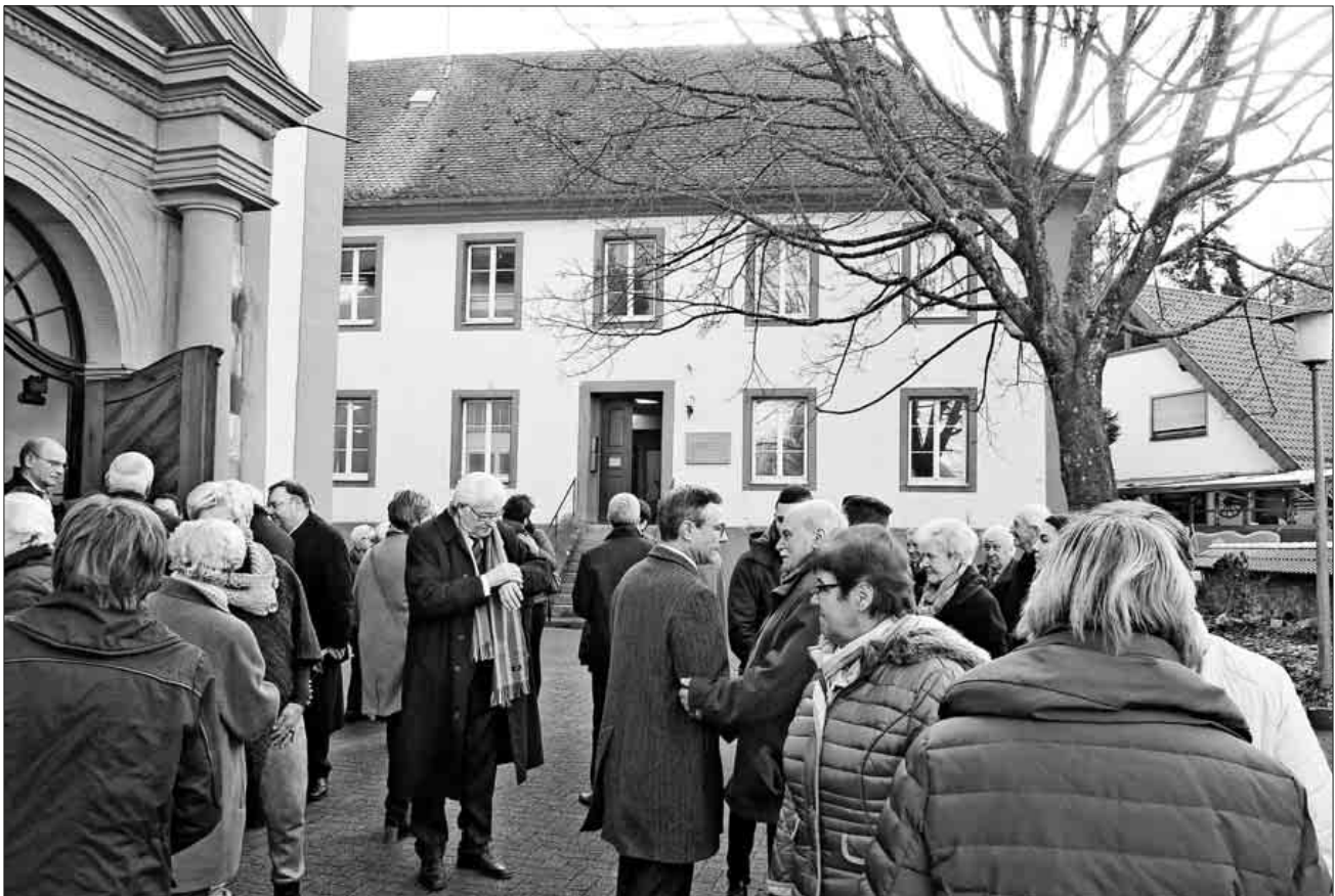
Zum letzten Male konnten die Heimbacher in ihr altes traditionsreiches, katholisches Gemeindehaus zu einem Neujahrsempfang gehen.