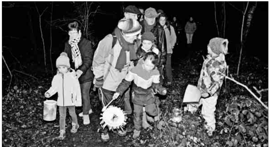
Stille zu spüren, ist ein besonderes Erlebnis. Bei der Lichterreise des Schwarzwaldvereins durch die Teningen Allmend erlebten die Teilnehmer die Vorweihnachtszeit ohne Trubel.

Der Schwarzwaldverein Teningen hatte zu einer Lichterreise im vorweihnachtlichen Winterwald eingeladen. In den längsten und dunkelsten Nächten des Jahres wurde gemeinsam in den Winterwald hinausgegangen und entlang kleiner Lichter eine Reise durch die Natur unternommen. Abseits des hektischen Advents- und Weihnachtstrubels konnte man den Winterschlaf der Tiere und Pflanzen spüren, in der Dunkelheit von einem Licht zum anderen zu gehen, um schließlich zu einem wärmenden Feuer zu kommen. Stille im finsternen Winterwald zu erleben – das war die Absicht des Teningen Schwarzwaldvereins. Rund 70 kleine und große Gäste, über die Hälfte Kinder, erlebten zwischen Abenddämmerung und Nacht eine rund zwei Kilometer lange Lichterreise durch die Teningen Allmend.