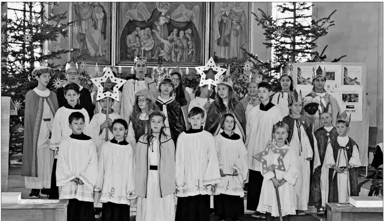
Die Sternsinger aus den Ortsteilen in der Kirche St. Marien

meinsames Mittagessen für alle, die mitgemacht hatten. Auch den Haushalten, in denen Menschen die Türe geöffnet, die Sternsinger freundlich willkommen geheißen und Geld gespendet hatten, sei herzlich gedankt. Wünschenswert ist, dass sich auch in Teningen im nächsten Jahr wieder genügend Kinder finden, die bereit sind, mitzumachen. Denn den Kindern, die einen oder zwei Nachmittage in den Weihnachtsferien dabei waren, hat es spürbar Freude gemacht. Sie haben Gemeinschaft mit anderen Kindern und Jugendlichen erlebt und sie wissen, dass sie etwas Sinnvolles getan haben. Sie konnten vor Ort, in ihrem Dorf, dazu beitragen, dass es manchen Kindern in Not, die weit weg in Indien und anderen viel ärmeren Ländern leben, ein Stück besser geht.