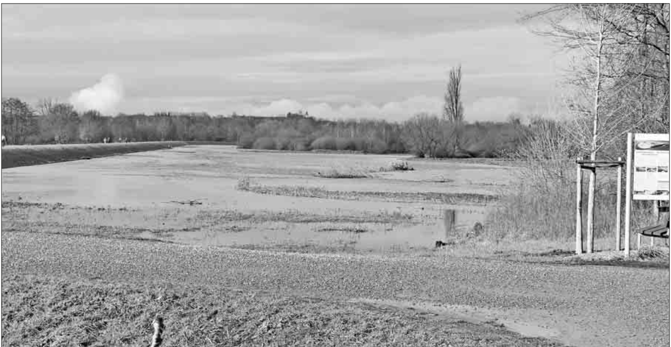
Links von der Elzbrücke aus kann sich nun die Elz bis zum neu verlegten Damm ausbreiten.