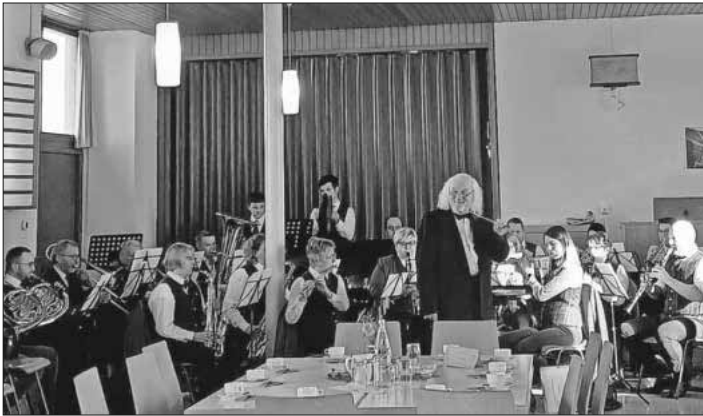
Der Musikverein Nimbung-Bottingen hat den Gemeindenachmittag mitgestaltet.