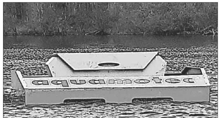
Schwimm-Ponton mit Antriebseinheit

Monitoring durch. Das heißt, dass monatlich Gewässerproben entnommen und ausgewertet werden, um eine Gesamtübersicht der wichtigen Parameter erstellen zu können. Von der maximalen Gewässertiefe, circa 15 Meter, waren bestenfalls noch neun Meter, im Sommer nur noch sechs Meter, als Lebensraum für die Fische möglich. Die Gefahr eines „Umkippens“ bei extrem ungünstiger Wetterlage wäre nicht mehr gänzlich auszuschließen gewesen. Die positive Entwicklung im kleinen See, da wird bereits seit 2014 eine Anlage zur Zwangsumwälzung betrieben, war ebenfalls ein Grund für den Einsatz einer Umwälzanlage. Ein herzliches Dankeschön gilt allen Beteiligten. Der Gemeindeverwaltung für die finanzielle Unterstützung, dem Bauhof für die Hilfe beim Einheben der Anlage, der DLRG-Ortsgruppe für die vielseitige Unterstützung und dem Tauchgang zum millimetergenauen Platzieren der Ansaugrohre und Befestigungs-Abspannungen, und natürlich den ASV-Mitgliedern, welche bereits im Vorfeld die nötigen Installations- und Fundamentierungsarbeiten für Stromkabel, Schaltschrank, etc. durchgeführt haben. Die erfolgreiche Durchführung ist ein schönes Beispiel für die gemeinsamen Bemühungen, die Naherholungszone Niederwaldsee zu schützen und bewahren.