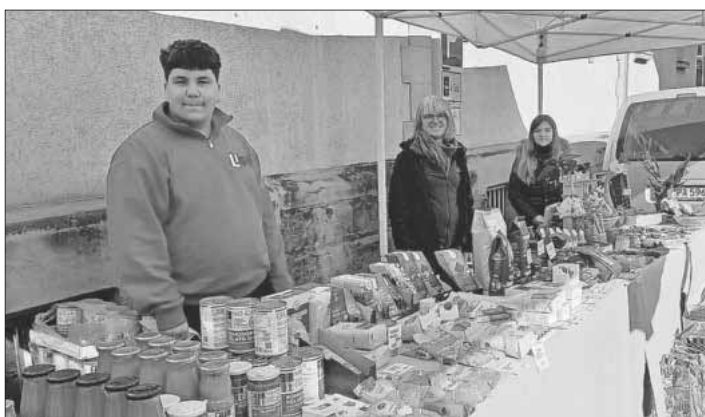
Am vergangenen Samstag wurden die fair gehandelten Produkte der „No Cap“-Linie verkauft.