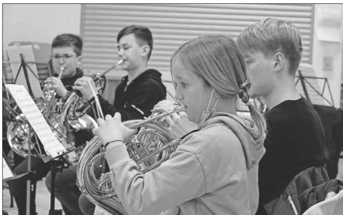
Gemeinsame Probe der Musikvereine aus der Großgemeinde.

Gefördert wurde das Wochenende über die Deutsche Bläserjugend mit Mitteln aus dem Kinder- und Jugendplan des Bundes im Aktionsprogramm „Aufholen nach Corona“.