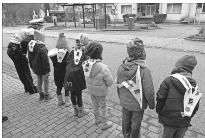
Verkehrspolizei bei den Schulanfängern.