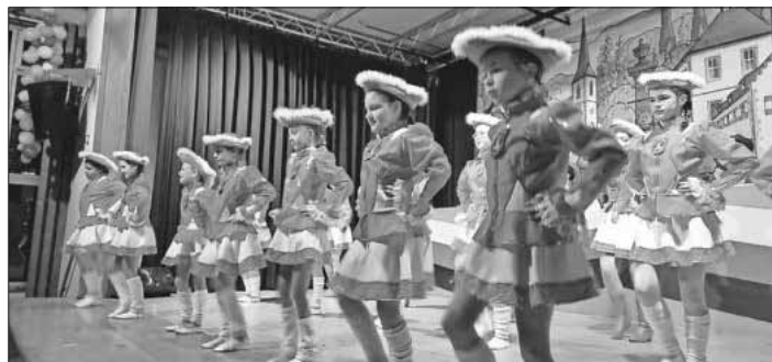
Die Mädchengarde tanzt bei der Narrensitzung.