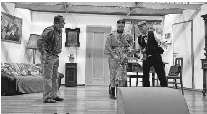
Die Theatergruppe in Aktion.

Im Anschluss spielte das Duo „Die Höllentäler“ auf. Die zahlreichen Gäste nutzten diese Gelegenheit, um bis in die frühen Morgenstunden das Tanzbein zu schwingen oder in der Bar gemütlich einen Trunk zu nehmen. Alle waren sich einig: Endlich wieder ein rundum gelungener Unterhaltungsabend nach zweijähriger Zwangspause!