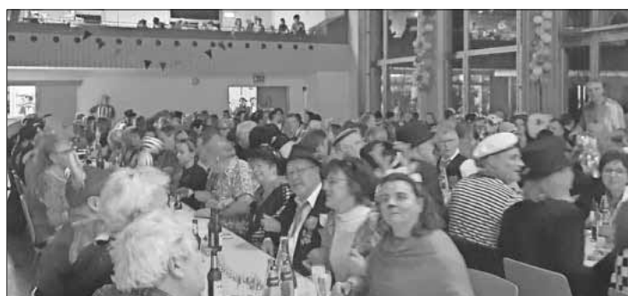
Die Anton-Götz-Halle war voll besetzt.