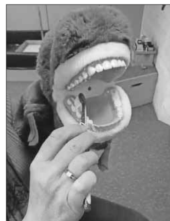
Zahnarzt zu Besuch im Kindergarten.

In der ersten Monatshälfte war die Verkehrspolizei Emmendingen im Kindergarten bei den Schulanfängern. Mit praktischen Übungen vor Ort erfuhren die „Großen“, wie man sich als Fußgänger im Straßenverkehr verhält. Weitere Themen hierbei waren: Reflektoren sind wichtig, damit man gesehen wird! Welche Telefonnummer hat die Polizei („1-1-0-sterci“)? Nie mit Fremden mitgehen! Randstein ist Stoppstein! Wie heiße ich und wo wohne ich (Vor- und Nachname, Straße, Hausnummer und Wohnort)? Richtiges Anschnallen im Kindersitz (Gurt unter beide „Hörnchen“). Danach konnten die Kinder das Polizeiauto genau unter die Lupe nehmen. Was hat eigentlich die Polizei im Kofferraum? Alles wurde genau erfragt und die Kinder waren dabei sehr interessiert. Natürlich wurden auch Sirene, Blaulicht und Mikrofon von den Kindern „getestet“.