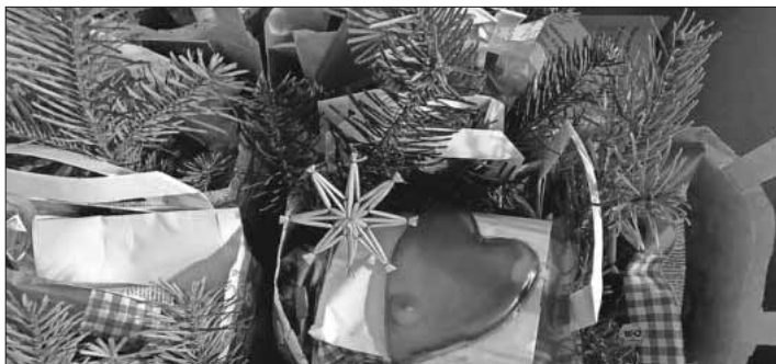
Der AWO-Ortsverein hat an alte, kranke und bedürftige Mitbürger Weihnachtstüten verschenkt.