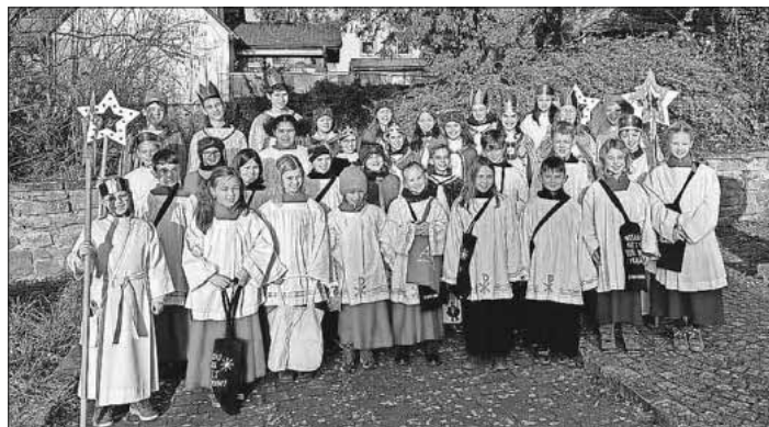
Die Sternsinger unterwegs in Heimbach.

Spenden können noch bis 15. Februar online über die Homepage der katholischen Kirchengemeinde Emmendingen-Teningen ( www.kath-emmendingen.de ) oder auf folgendes Spendenkonto getätigt werden: rk. Kirchengemeinde EM-TE, IBAN: DE73 6805 0101 0020 0146 81, Verwendungszweck: Sternsingeraktion 2023 St. Gallus Heimbach.