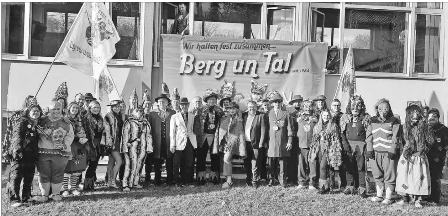
Die Narren der Berg- und Tal-Zünfte.