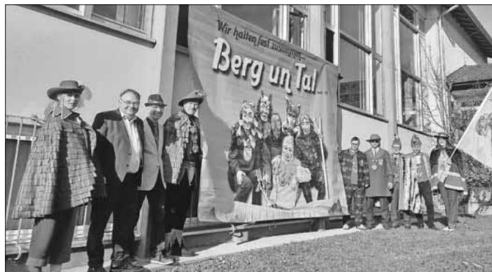
Die Verantwortlichen bei der Bannerübergabe des Berg- und Tal-Treffens.

Das eigentliche Berg- und Tal-Treffen findet von Freitag bis Sonntag, 27. bis 29. Januar, statt: Am Veranstaltungsfreitag beginnt um 20.11 Uhr das Teufel- und Hexentreffen in der Anton-Götz-Halle. Der Samstag beginnt um 18.33 Uhr mit der Narrenmesse in der Kirche, der Zunftabend geht um 20.11 Uhr los. Hier werden über 1.000 Gäste erwartet. Weiter geht es am Sonntag ab 11.33 Uhr mit dem Zunftmeisterempfang. Ein besonderes Highlight ist am Sonntag der Jubiläumsumzug durch Heimbach: Hier nehmen ab 13.33 Uhr rund 2.000 Narren aus 55 Zünften teil. Die Strecke ist dieselbe wie beim Umzug am Faschingsdienstag. Nach dem Umzug gibt es ein kleines Programm mit Tänzen und Musik auf dem gesamten Festgelände im Bereich um das Rathaus und das Schlosscafé.