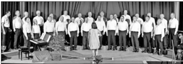
Der Männerchor Heimbach beim Jahreskonzert am 22. November 2014 in der Anton-Götz-Halle in Heimbach unter dem Motto: „Ich küsse Ihre Hand, Madame“.

Der Eintritt ist frei. Über eine Spende zur Unterstützung des Engagements für schöne Chormusik wären der Veranstalter und die Mitwirkenden dankbar. Der Männerchor Heimbach und seine Gäste würden sich freuen, möglichst viele Besucher begrüßen zu dürfen.