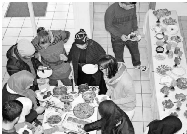
Ein reichhaltiges Angebot.

Der Empfang war herzlich, alle Flüchtlinge wurden willkommen geheißen und kannten jemanden vom Helferkreis. Auch irakische Flüchtlingsfamilien, die erst seit kurzer Zeit in Bottingen untergebracht sind, waren gekommen. Die Stimmung und die Gespräche während des gemeinsamen Frühstücks waren herzlich und lebhaft. Die Kinder konnten im Obergeschoss spielen, malen und basteln, es wurde geredet und gelacht. Nicht nur für die Kinder aus Syrien und dem Irak, sondern auch für die betreuenden Jugendlichen war das eine gute Erfahrung und eine Gelegenheit, sich kennenzulernen.