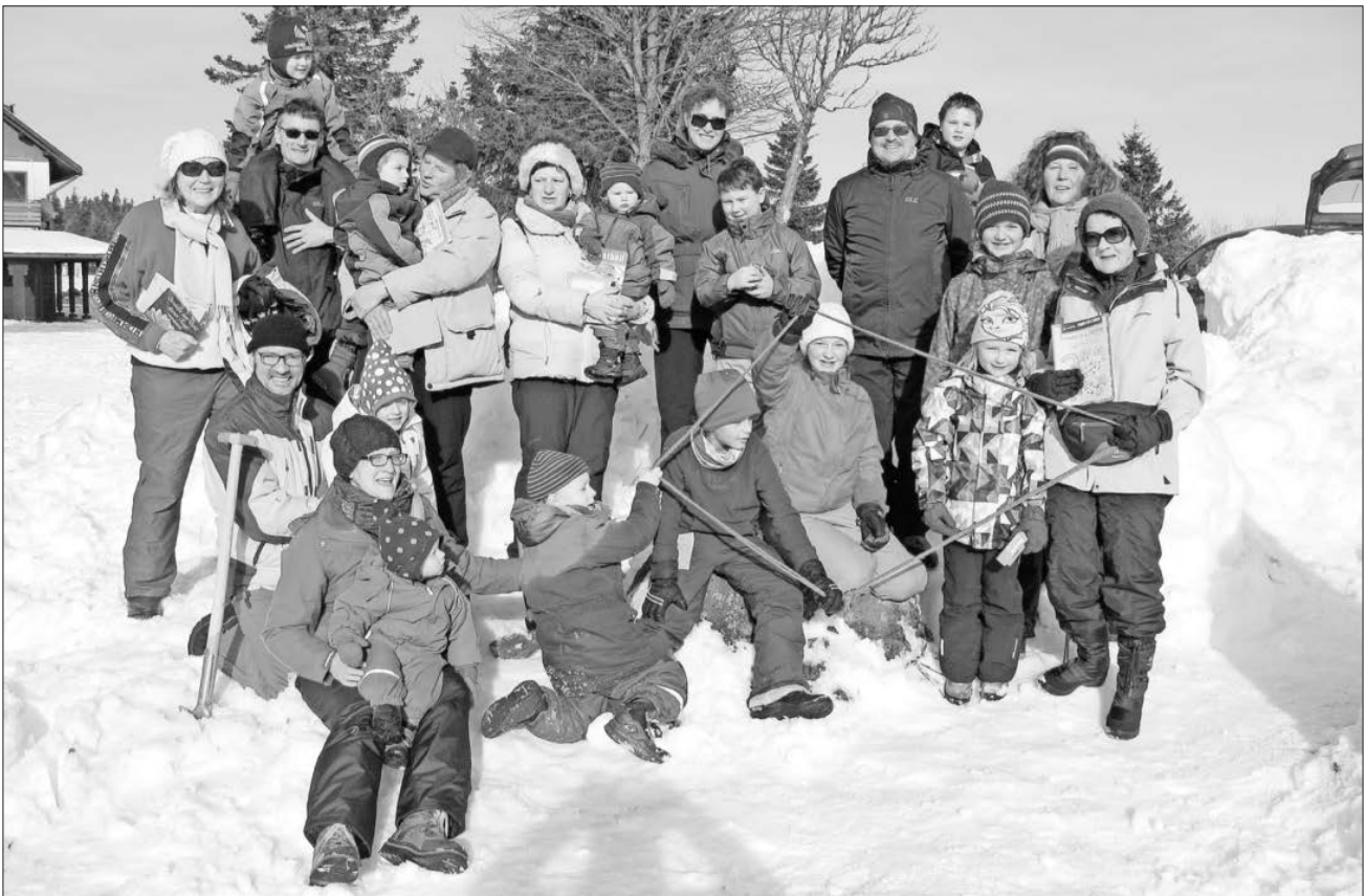
Begeisterte Familien beim Erlebnistag „Spaß im Schnee“.