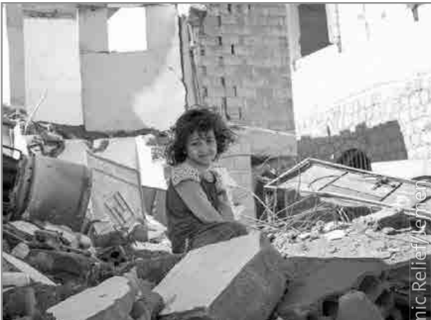
Islamic Relief Jemen

Motto im Monat Oktober : „Ein Buch kann ein Freund sein“ Die Coronavorschriften werden streng eingehalten! Das Bücherei-Team freut sich über regen Besuch.