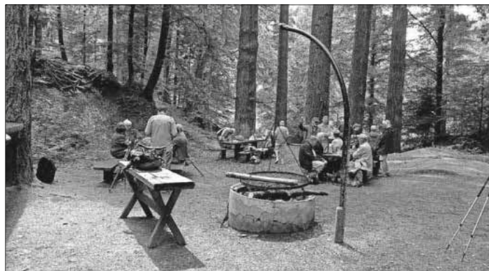
Stärkung auf einem schönen Picknickplatz.

Am Abend überreichten die französischen Freunde Geschenke an die Organisatoren dieser Wanderwoche und präsentierten bei dieser Gelegenheit das Projekt für die nächstjährige Wanderwoche in Frankreich. Als Ausgangsort ist Châtillon-sur-Chalaronne gewählt, gelegen im Departement Ain in der Region Auvergne-Rhône-Alpes. Zeitig verabschiedeten sich die Freunde aus Frankreich nach dem Frühstück, um noch an den Parlamentswahlen teilnehmen zu können.