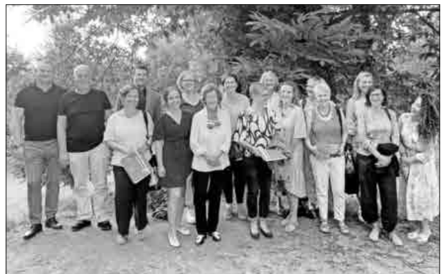
15 neue Helferinnen und Helfer unterstützen ab sofort ehrenamtlich den ambulanten Kinder- und Jugendhospizdienst der Malteser im Landkreis Emmendingen.

Das Angebot ist unabhängig von Nationalität oder Konfession und für die betroffenen Familien kostenfrei, es wird von Spenden getragen.