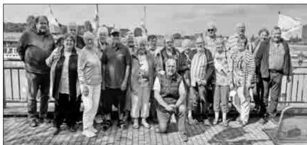
Eine Schifffahrt, die ist lustig, so wie im Duisburger Hafen.