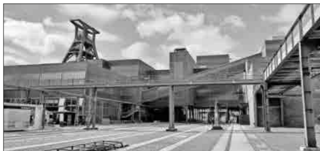
Weltkulturerbe Zeche Zollverein in Essen.

Am letzten Tag ging es dann zum letzten Mal durch die wuseligen unzähligen „Autoschlängen“, die aber interessanterweise nie zum Stillstand kam, zurück nach Teningen.