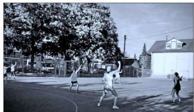
Im vorgeschriebenen Abstand trainierte die Zumba-Gruppe auf dem Schulsportplatz.

Ab September startet die Zumba-Gruppe wieder voll durch. Nähere Infos finden Interessierte auf der Internetseite des TV Köndringen.