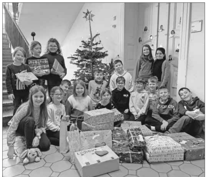
Die Päckchen sind für die Waisenkinder in der Ukraine gepackt.

Ein herzlicher Dank geht an alle Schülerinnen und Schüler sowie deren Eltern, die diese tolle Aktion ermöglicht haben.