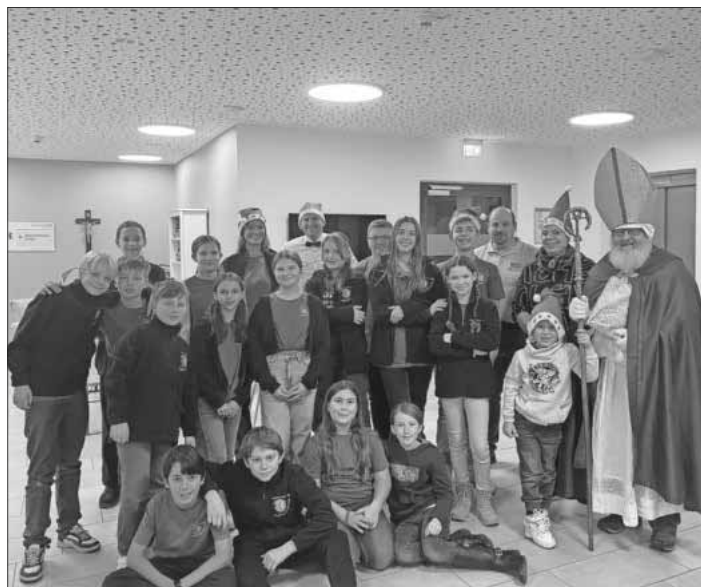
Das Jugendrotkreuz brachte viel Freude in das Seniorenstift.

Am 6. Dezember besuchte das Jugendrotkreuz Teningen das Seniorenstift. In den vorangegangenen Gruppenstunden wurden fleißig Geschenke gebastelt, die beim Besuch an die Bewohner übergeben wurden. Mit der musikalischen Unterstützung von Trompete, Gitarre und Klavier wurden gemeinsam Weihnachtslieder gesungen. Im Anschluss freuten sich die Kinder über Kuchen, Süßigkeiten und Getränke, die das Seniorenstift für sie vorbereitet hatte.