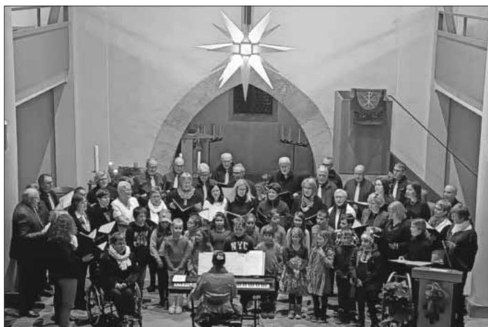
Die gesamten Chöre beim Adventskonzert.

Der Gesangverein Teningen bedankt sich bei allen Mitgliedern, Gästen und Zuschauern. Ebenso bedankt sich der Gesangverein bei der Kirchengemeinde für die Erlaubnis bei der Bewirtung in der Kirche, die es ermöglichte, Suppe und Glühwein/Punsch anzubieten. In diesem Sinne wünscht der Gesangverein Teningen fröhliche Weihnachten und einen guten Rutsch in ein neues Sängerjahr!