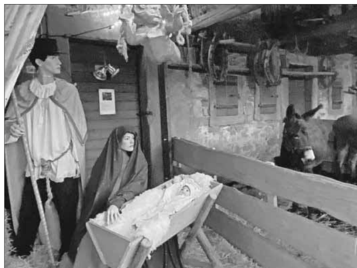
Die Weihnachtskrippe lockte wie jedes Jahr viele Besucher an.