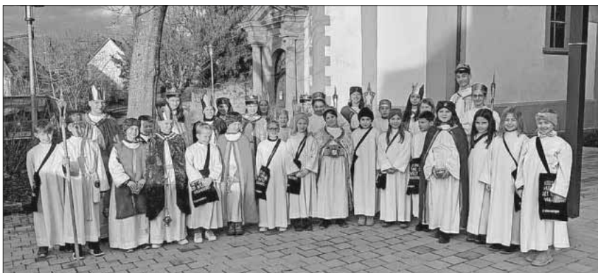
Die Sternsinger 2024 unterwegs in Heimbach.

Unter dem Motto „Gemeinsam für unsere Erde – in Amazonien und weltweit“ waren die Sternsinger zwischen Weihnachten und Dreikönig wieder unterwegs in Heimbachs Straßen. Sie zogen von Haus zu Haus, überbrachten die Segenswünsche und sammelten reichlich Spenden, die in diesem Jahr hauptsächlich in Projekten für Kinder in Amazonien verwendet werden. Ein herzliches Dankeschön gilt den Kindern, die mit großer Freude und viel Engagement dabei waren, dem Sternsinger-Team und seinen Helfern für ihren Einsatz vor, während und nach der Aktion und nicht zuletzt allen Spendern. Mit den Spenden hoffen die Sternsinger, die Not der Kinder weltweit etwas lindern zu können und die Welt ein Stückchen besser zu machen.