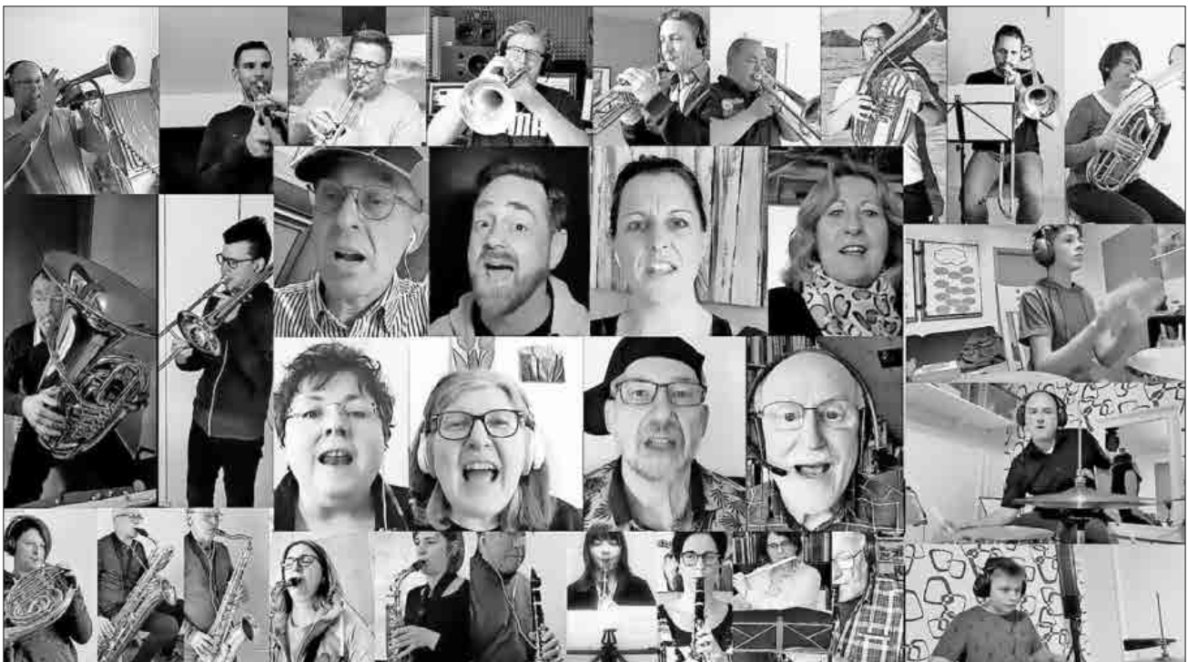
Der „Lockdown Groove“ des Musikvereins Heimbach

„Zämme in de Mai“: Durch die Einschränkungen aufgrund der Pandemie suchte man auch in diesem Jahr andere Wege als gewohnt, den Mai musikalisch zu begrüßen. Zusammen mit allen anderen Teninger Musikvereinen beteiligte sich der Musikverein Heimbach an der Aktion „Zämme in de Mai“. Pünktlich um 10 Uhr waren aus Fenstern und von Balkonen einige Lieder, darunter natürlich „Der Mai ist gekommen“, zu hören. Der Musikverein möchte sich auf diesem Wege recht herzlich für den Applaus bedanken und freut sich auf ein baldiges Wiedersehen.