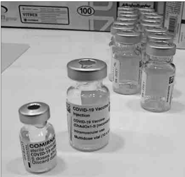
Begehrter Inhalt: Im Kreisimpfzentrum werden bisher die Impfstoffe von Biontech-Pfizer (links) und AstraZeneca (rechts) verabreicht.

In die Impfkampagne sind seit Mitte April auch die Hausärzte einbezogen. Im Landkreis Emmendingen verabreichen 80 Hausärzte in ihren Praxen den Impfstoff – bis zum vergangenen Wochenende wurden von ihnen insgesamt 6.534 Covid-Impfungen ausgeführt.