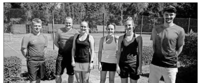
Die junge Mannschaft des TC Heimbach in der Mixed-Runde.

Das nächste Medenspiel dieser Gruppe wird dann am 19. September gegen das Team des TC Sexau ausgetragen. Derweil wird am kommenden Samstag die 50er Mannschaft auf heimischem Court gegen Schutterwald antreten.