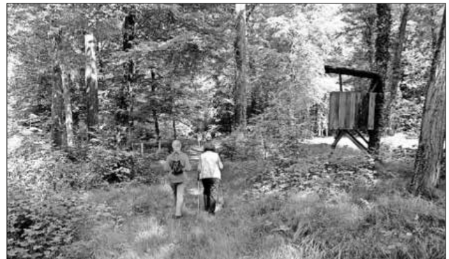
Genusswandern in der Teningen Allmend - fit werden in freier Natur.

Denzlinger Straße 42 79312 Emmendingen Telefon 0 76 41 - 93 800