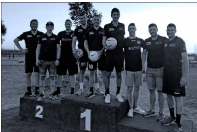
Die Herren II der SG Köndringen-Teningen beim Fußballgolf.