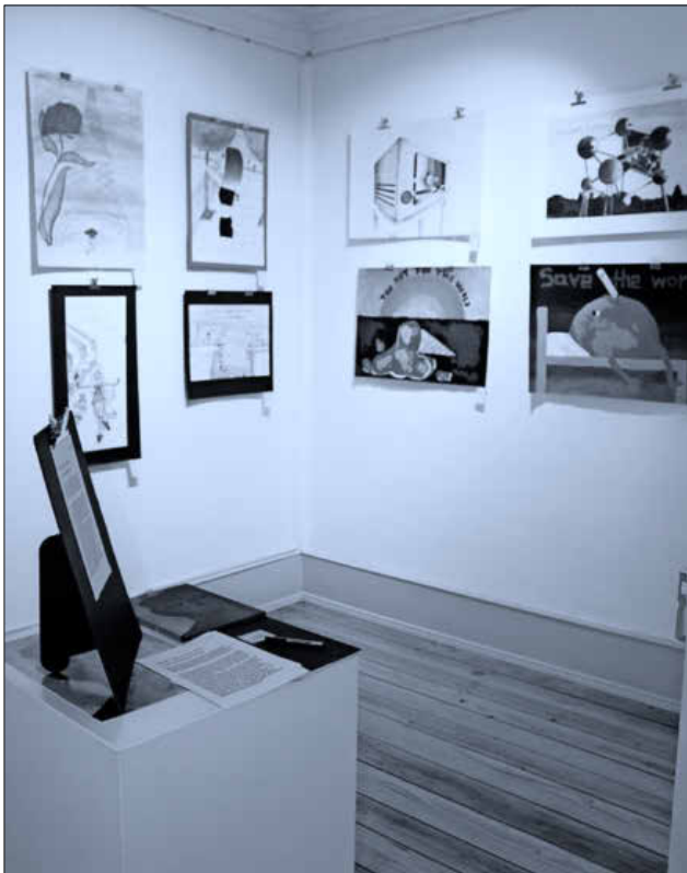
Die Schülerinnen und Schüler präsentieren eine Auswahl von Bildern des diesjährigen europäischen Wettbewerbs.

Die Ausstellung im Rebay-Haus (Emmendinger Straße 11, Teningen) ist an den Sonntagen 13. und 20. September jeweils von 14 bis 17 Uhr geöffnet. Führungen zu anderen Zeiten sind auf Anfrage möglich: Rebay-Foerderverein@t-online.de .