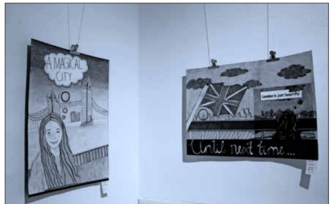
Die Bilder können im Rebay-Haus besichtigt werden.