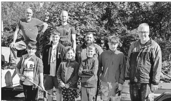
Säuberungstrupp nach getaner Arbeit.

Auch dieses Jahr wurde im Rahmen des Bachabschlages der Mühlbach von etlichem „Weggeworfenen“ befreit. Ein Teil der Jugendgruppe und deren Betreuer waren einen ganzen Vormittag damit beschäftigt, das Bachbett von Verpackungsmüll, Plastik- und Stahlteilen und sonstigem Unrat zu befreien. Es ist immer wieder erstaunlich, was sich im Lauf des Jahres, beabsichtigt oder auch unbeabsichtigt, so alles ansammelt. Vielen Dank an alle Teilnehmenden. Ein weiteres Dankeschön gilt dem Bauhof Teningen, der den gesammelten Müll (zwei Autoanhänger voll) entsorgte.