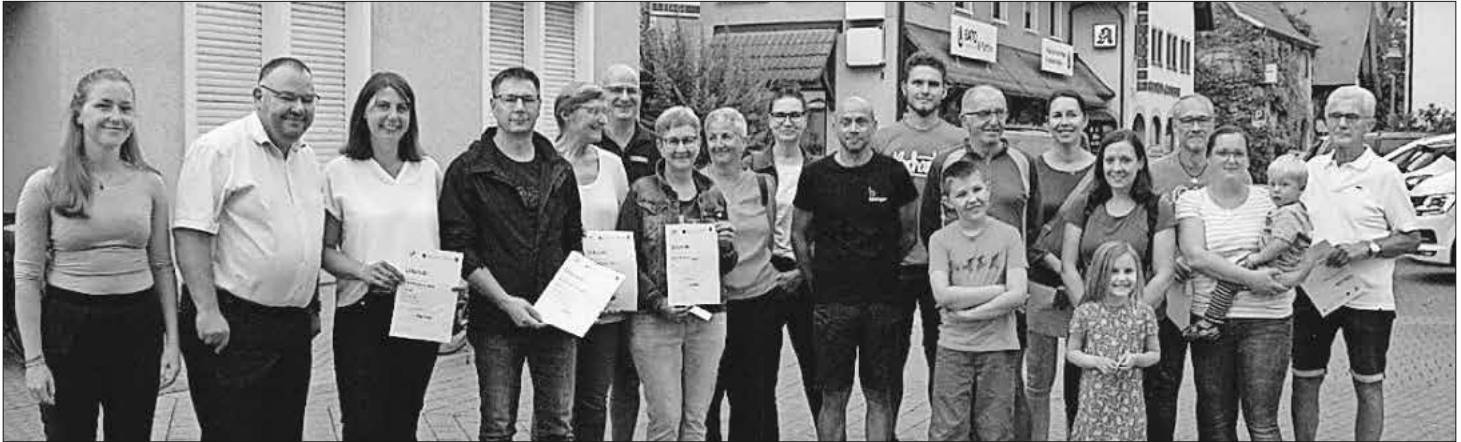
Die besten Teams und Radelnde bei der Preisverleihung am Kronenplatz.

Die Gemeinde Teningen ist sehr zufrieden mit dem Ergebnis und freut sich schon auf die Stadtradel-Saison im kommenden Jahr.