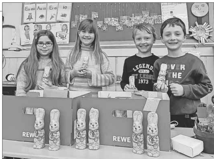
Da lacht das Herz.