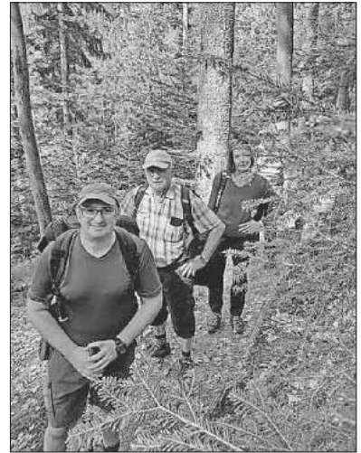
Trotz Startschwierigkeiten eine schöne Wanderung.

An diesem herrlichen Tag war es der Wandergruppe gelungen, bei bestem Wetter zwei schöne Orte des Hochschwarzwalds zu verbinden. Trotz aller Schwierigkeiten am Anfang und dank der Flexibilität der Gruppe war es ein wunderschöner Wandertag.