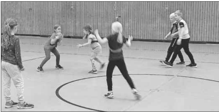
Die Kinder beim Ballspiel.

Weiter geht es mit SpoFunnis-Aktivitäten in den Pfingst- und Sommerferien. Vom 7. bis 10. Juni findet „Sport&Fun“ ebenso statt wie in den Sommerferien vom 22. August bis 9. September. Der Teilnahme-Beitrag beläuft sich auf 5,50 Euro, Geschwisterkinder zahlen jeweils 5 Euro. Auch für diese Programme wird um Voranmeldung gebeten. Anmeldung und Rückfragen sind möglich unter spuero@spofunnis.de sowie unter Telefon 07641 / 9379999. Weitere Informationen sind zu finden auf www.spofunnis.de .