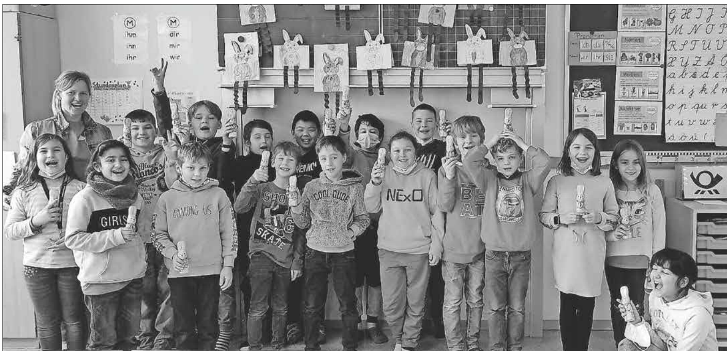
Große Freude bei den Kindern über die Osterhasen.