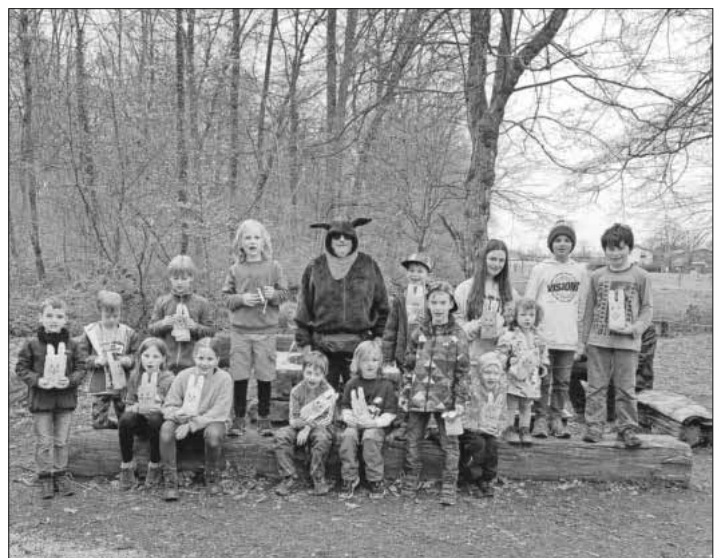
Die Kinder mit dem Osterhasen.

Fast 20 Kinder mit Eltern und Großeltern nahmen die etwa drei Kilometer lange Verfolgung auf. Schließlich wurde der Osterhase gefangen, als Lohn gab es ein Geschenk für jedes Kind. Wie essich für den Osterhasen gehört, mussten diese Geschenke natürlich zuerst gesucht werden. Am Lagerfeuer bei Punsch, Kaffee und Kuchen endete die Veranstaltung entspannt. Bei Kindern und Eltern wird besonders „ihr“ Osterhase in Erinnerung bleiben.