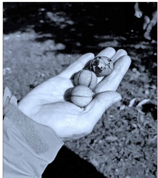
Schwere grüne Nüsse sind typisch für die Hickory.

Das Teningen Rote Kreuz bietet wieder in Kooperation mit der Volkshochschule ab 13. April 2021 sechsmal dienstags von 9.30 bis 11.30 Uhr Gesundheitswanderungen an. Anmeldung unter Telefon 07641 / 92250.