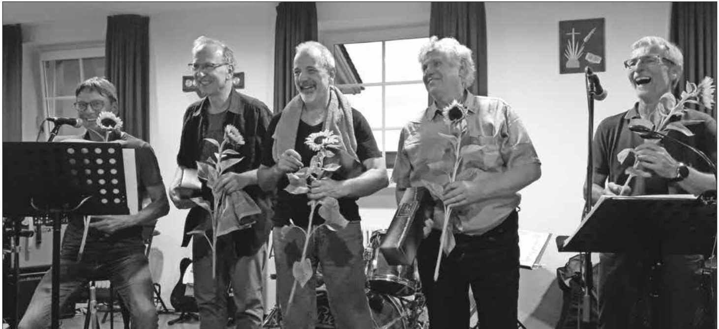
Die Musiker bekamen als Dank ein Präsent überreicht.