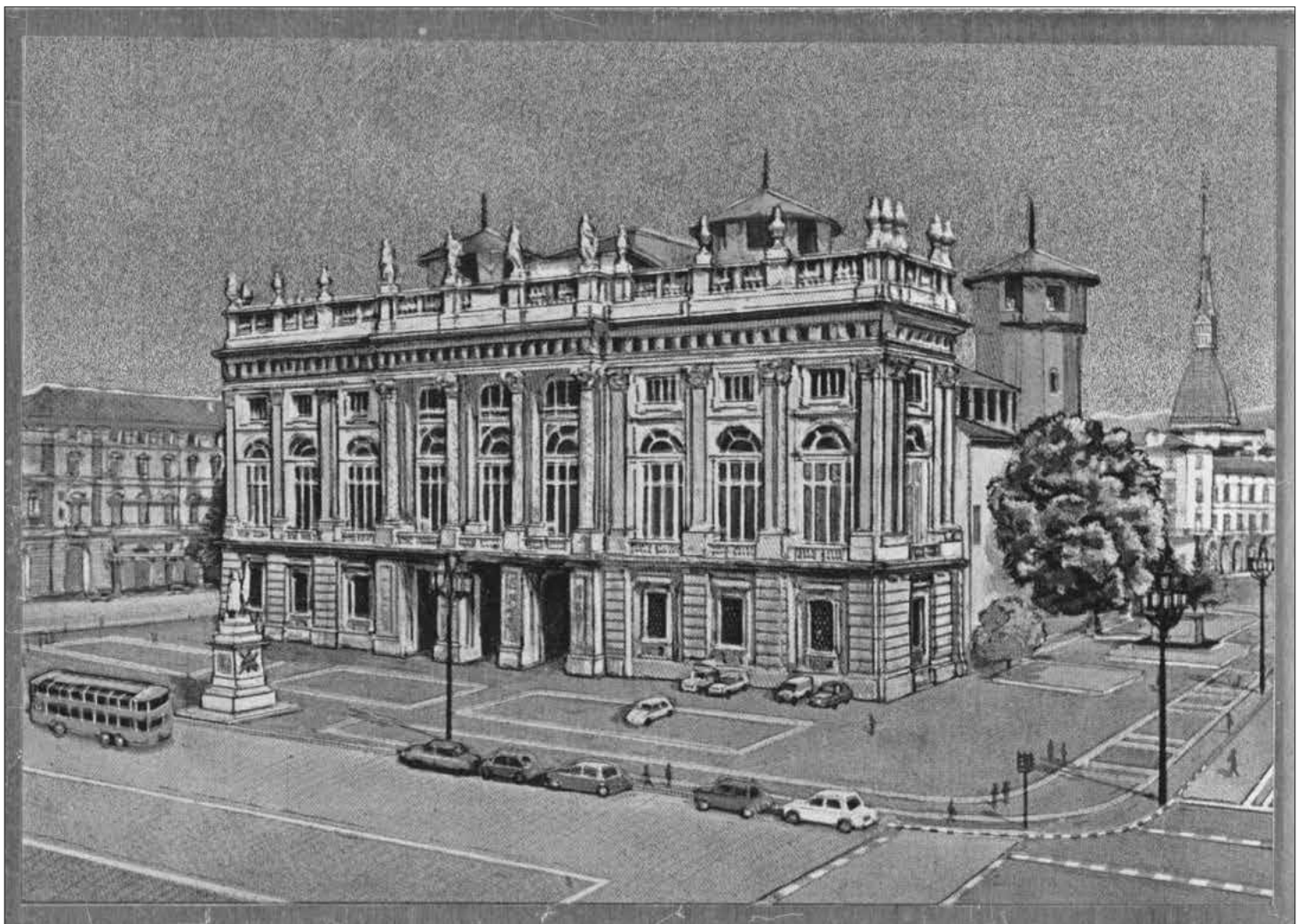
Palazzo Madama in Turin.

Um besser planen zu können, wird um Anmeldung gebeten, telefonisch unter 07641 / 49421 (Anrufbeantworter) oder per E-Mail an die Adresse Rebay-Foerderverein@t-online.de .