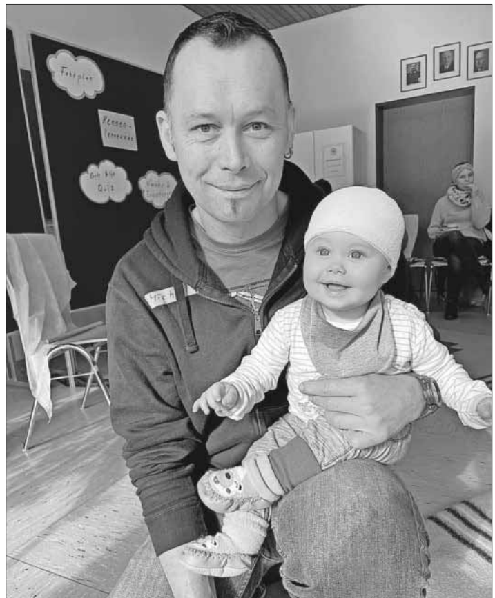
Erwachsene und auch Kinder sind beim Kindernotfallkurs willkommen.

Termin: Samstag, 16. September. Kursdauer: 9 bis 13 Uhr. Lehrgangsort: Teningen, DRK-Heim, Neudorfstraße 40. Anmeldung: Telefon 07641 / 9225-0, E-Mail: info@vhs-em.de, Internet www.vhs-em.de.