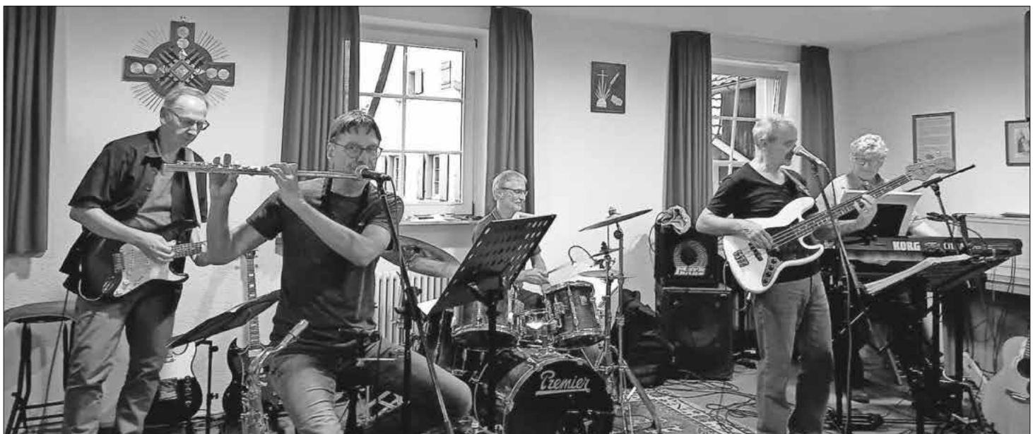
Die Band Andromeda beim Serenaden-Konzert.