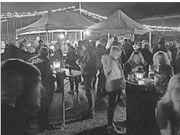
Bereits im vergangenen Jahr war der Glühweinhock gut besucht.

Tags darauf wurde der Hockeyplatz winterfest gemacht und für den anstehenden Glühweinhock hergerichtet. Dieser findet an diesem Freitag, 1. Dezember, ab 18 Uhr am Nimburger Hockeyplatz statt. Für das leibliche Wohl ist gesorgt. Die Skatebahn ist beleuchtet und zum Inlineskaten geöffnet. Den musikalischen Rahmen gestaltet wieder der Musikverein Nimburg-Bottingen. Der Verein freut sich über zahlreiche Besucher!