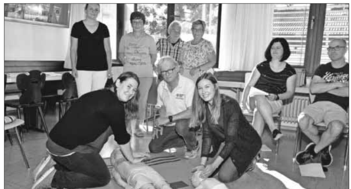
Unter anderem wird beim Kindernotfallkurs die Wiederbelebung von Säuglingen und Kleinkindern geübt.

In einem speziellen Erste-Hilfe-Kurs am Kind rückt der DRK-Ortsverein Teningen die besonderen Anforderungen der Jüngsten bei einem Notfall in den Blickpunkt. Eltern, Großeltern, Tagesmütter und Erzieher bekommen altersgerechte Hilfestellungen für Kindernotfälle an die Hand. Die nötige Sicherheit im Umgang mit dieser besonderen Herausforderung erlangt man durch Übungen gepaart mit genauem Hintergrundwissen. Termin ist am Samstag, 16. Dezember , von 9 bis 13 Uhr. Lehrgangsort: DRK-Heim, Neudorfstraße 40. Anmeldung: Telefon 07641 / 92250, E-Mail info@vhs-em.de , Internet www.vhs-em.de .