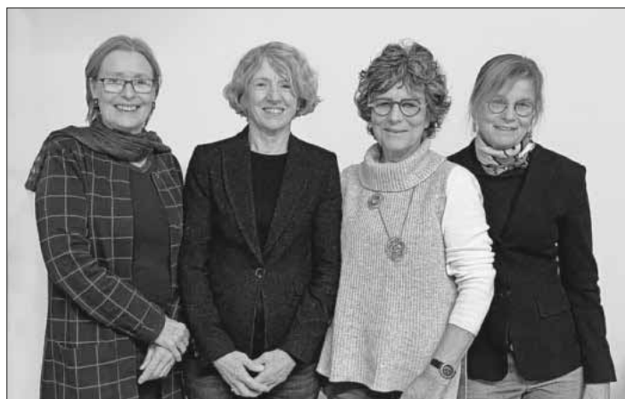
Der neue „weibliche“ Vorstand.

Beim anschließenden Ausklang mit Gebäck und Wein gab es noch Zeit für Gespräche und Austausch untereinander – auch eine wichtige Tradition im Kulturverein.