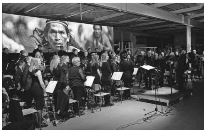
Die Winzerkapelle bei ihrem Konzertereignis.