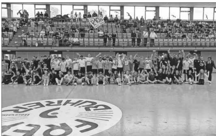
Alle Mannschaften der Schule, hier die Klassen 9 und 10, wurden tatkräftig von den Mitschülern angefeuert.

Ein herzliches Dankeschön geht auch an alle Organisatoren und Helfer, insbesondere an die Sanitärer-AG, die Schiedsrichter-Teams und die Turnierleitung, allesamt Schülerinnen und Schüler, die großartige Arbeit geleistet haben. Die Theodor-Frank-Schule freut sich schon auf nächstes Jahr!