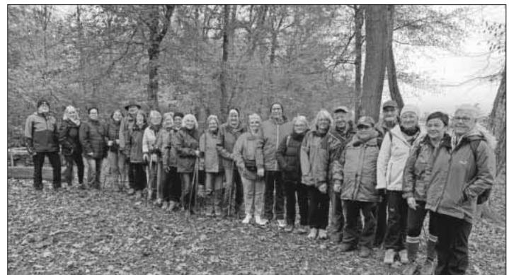
Die Teilnehmer genossen die Gesundheitswanderung im Teningen Allmendwald.