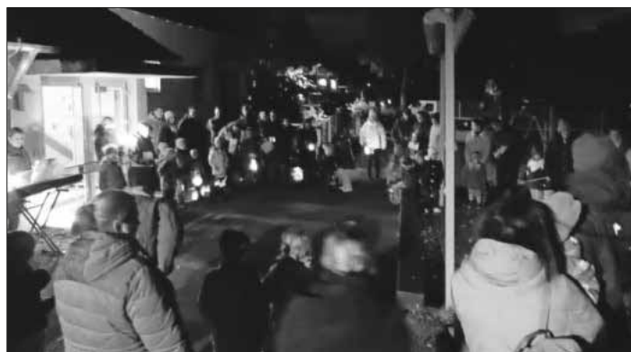
Gemeinsamer Singkreis mit Kindergartenfamilien zur Martinsfeier im Kindergarten.