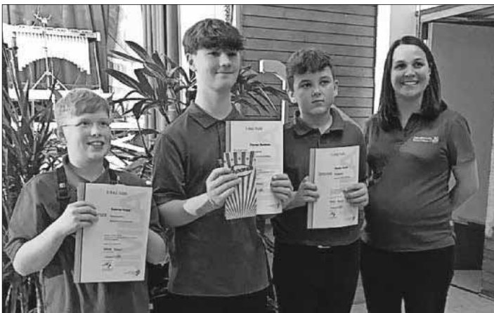
Die geehrte Jugend zeigte stolz ihre Urkunden.