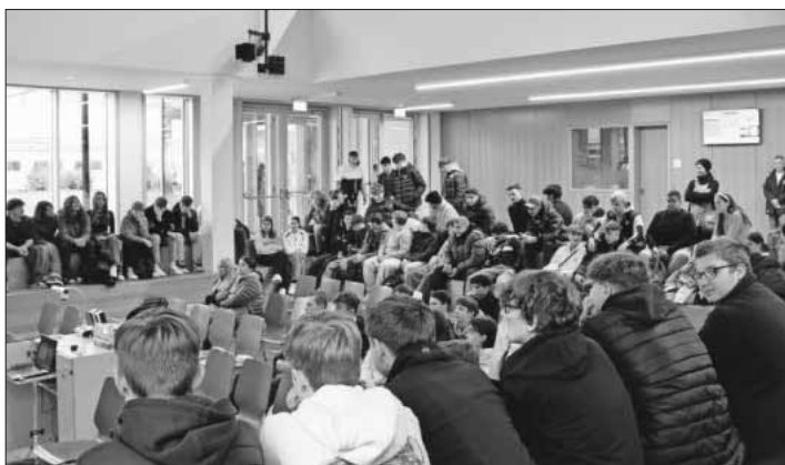
Die Schülerinnen und Schüler bei den Vorträgen der Firmen in der Aula des Schulzentrums.

Der Berufsinformationstag an der Theodor-Frank-Schule war somit eine gelungene Veranstaltung, die bei sämtlichen Beteiligten auf eine äußerst positive Resonanz gestoßen ist.