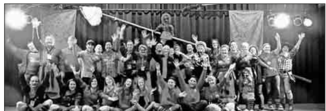
Die am 7. Januar 1989 gegründete Narrenzunft besteht aus 35 Hexen und Teufeln, die jedes Jahr aufs neue die närrische Zeit in Nimburg und Bottingen zelebrieren.