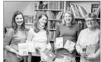
Das Büchereiteam freute sich über den Buchpreis.