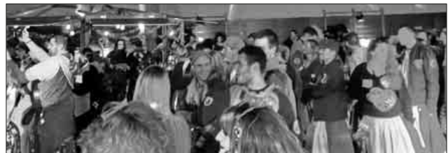
Ausgelassene Stimmung in der Nimberghalle.

Die Felse-Trieber bedanken sich bei allen, die zum Gelingen der Veranstaltung beigetragen haben, und freuen sich schon jetzt auf die Kampagne 2019/2020.