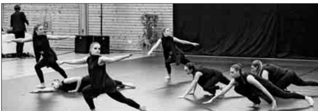
„Effect“ im kleinen Finale.

Effect konnte die Kampfrichter überzeugen, die gleich fünfmal den ersten Platz zeigten und die Mannschaft somit als Sieger des kleinen Finales sahen. Am Ende belegte Effect den achten und Jazz à Nova den zehnten Platz.