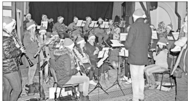
Das Jugend-Projektorchester Mundingen/Teningen auf dem Weihnachtsmarkt im Europa-Park in Rust.

Am Ende des Tages waren sich alle einig, dass dieser Ausflug bald wiederholt werden muss. Informationen zur Musikalischen Ausbildung der Musik und Feuerwehrkapelle Teningen findet man unter www.mfk-teningen.de .