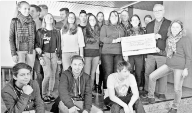
Die Schülerinnen und Schüler der 9. Klasse freuten sich, der Stiftung Brücke eine Spende in Höhe von 1.660 Euro überreichen zu können.

Info: www.stiftung-bruecke.de ; Spendenkonto: 474; Bank für Sozialwirtschaft, BLZ: 100 205 00; BIC: BFSWDE33BER; IBAN: DE12100205000003247404.