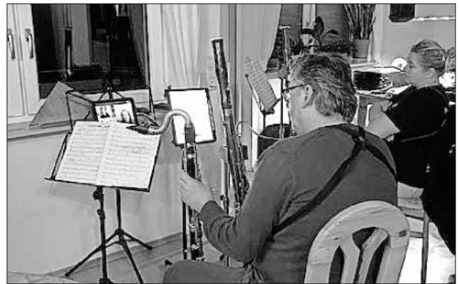
Die Musiker proben virtuell zu Hause.