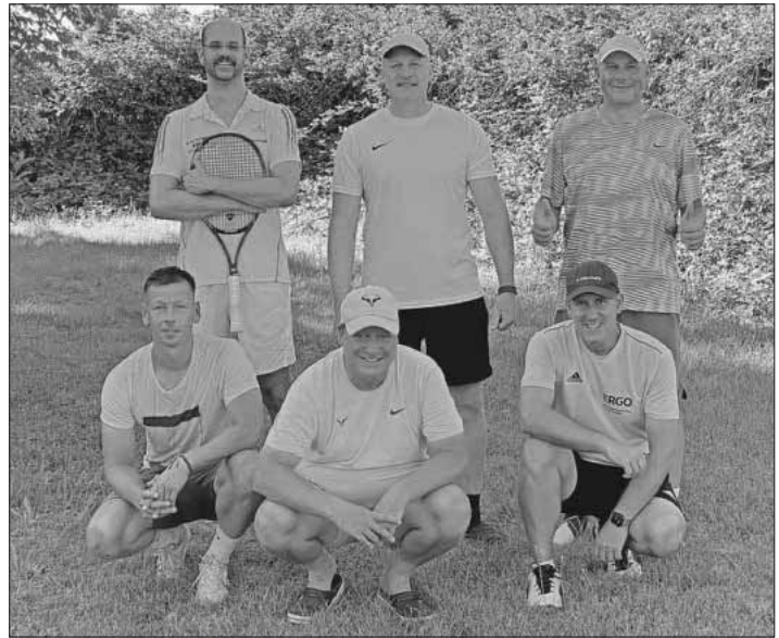
Herren 40 Mannschaft der TSG Köndringen/Teningen

Die Tennisspielgemeinschaft (TSG) Köndringen/Teningen Herren 40 mussten zum Saisonabschluss nochmals beim TC Altenheim (Neuried) antreten. Wie die Temperaturen waren auch die Spiele heiß umkämpft. Einen verletzungsbedingten Ausfall während des Spiels hatte die TSG zu leider zu beklagen. Nach den Einzeln konnte die TSG jedoch mit der 5:1-Führung alles in trockene Tücher packen. Ein Doppel musste aufgrund des Ausfalles abgegeben werden. Die verbliebenen zwei Doppel waren wie die Einzel umkämpft und mussten beide im Match-Tiebreak entschieden werden. Bei einem hatte die TSG dann das glücklichere Ende. Der 6:3-Sieg zum Saisonende war letztlich verdient und brachte mit einem 8:4-Punktstand den 3. Tabellenplatz ein.