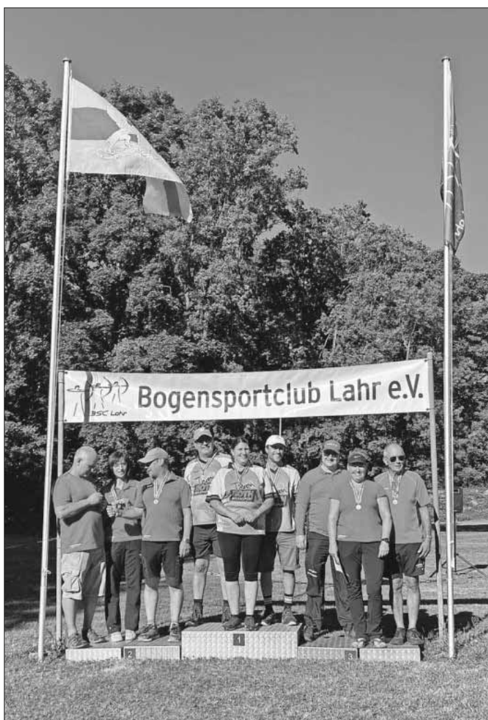
Der BSV Teningen bei der Mannschaftswertung Compound auf den Plätzen 2 und 3.

Vier der sechs Compoundschützen haben ein Ergebnis geschossen, welches im letzten Jahr die Qualifikation zur Deutschen Meisterschaft bedeutet hätte. Die Ringzahlen für die diesjährige DM, welche im September in Wiesbaden stattfindet, werden jedoch erst in den nächsten Wochen festgelegt, nachdem alle Landesmeisterschaften in Deutschland abgeschlossen sind.