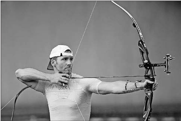
Volle Konzentration beim Schuss.

Weitere Bilder vom Wettbewerb gibt es auf der Facebook-Seite vom BSV Teningen.