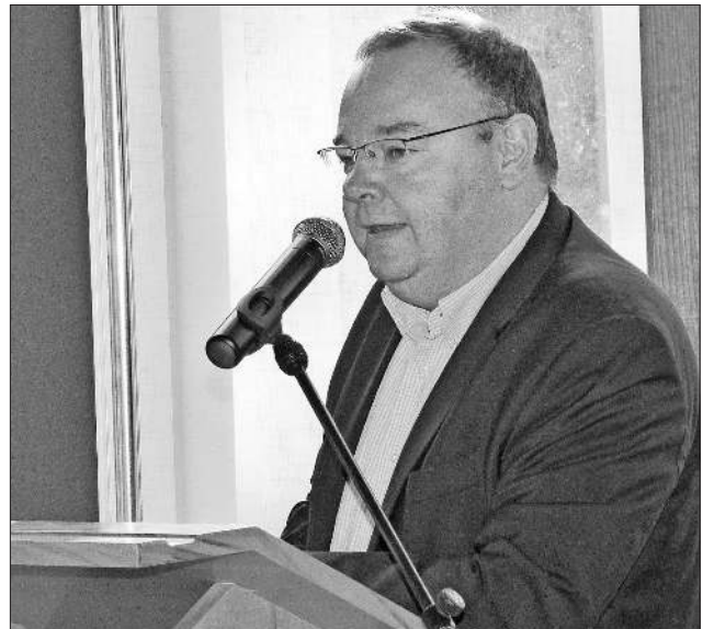
Bürgermeister Heinz-Rudolf Hagenacker begrüßt die Initiative.

Worte, die auch von Bürgermeister Heinz-Rudolf Hagenacker in seinem Grußwort unterstrichen wurden. „Dies ist ein Fundament für die Zukunft, wer die Herausforderung annimmt, braucht viel Kreativität, Mut und Ideen, um sie zu verwirklichen. Denn alles lässt sich nicht gleich umsetzen, alles braucht seine Zeit. Es ist wie bei einer kleinen Pflanze, die ihren Zeitabschnitt braucht, um einen großen Stamm zu entwickeln, um dann end-