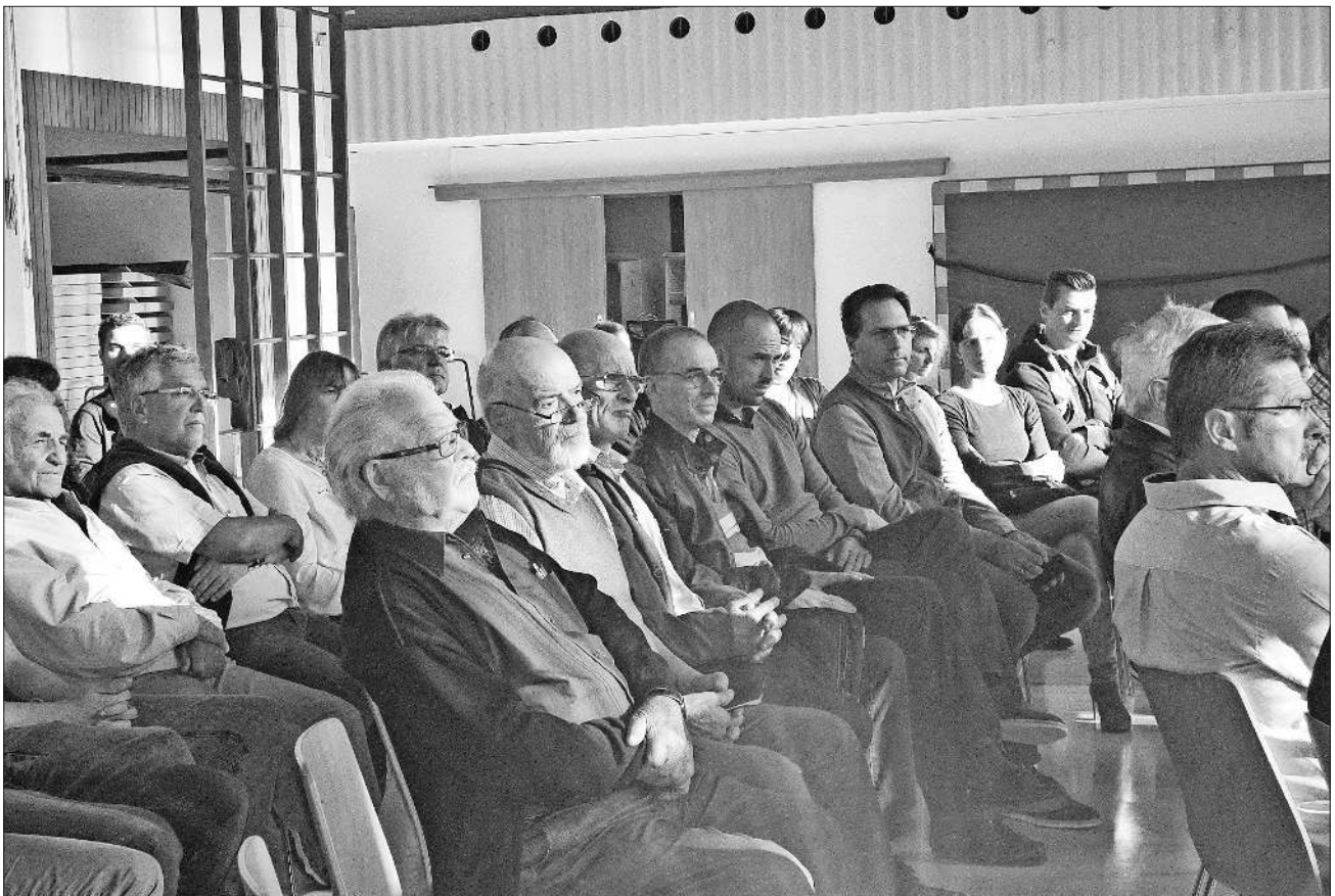
Interessierte Bewohner Heimbachs.

Laufe der folgenden Monate unabhängig voneinander die Thematik abarbeiten und die Ergebnisse dann in regelmäßigen Abständen dem Ortschaftsratsausschuss präsentieren. Der Ausschuss wird dann die notwendigen Entscheidungen oder Maßnahmen einleiten. Damit soll der Grundstein für ein lebendiges Heimbach gelegt werden.