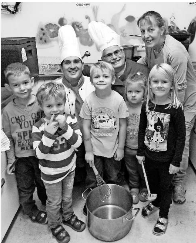
Spaß hat's gemacht.