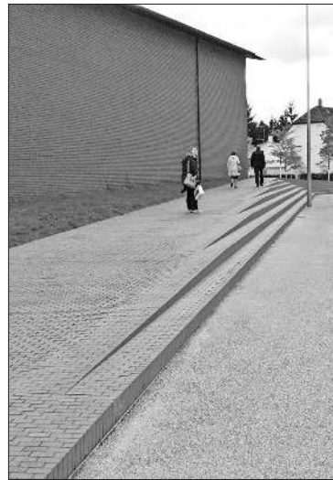
Zugang zum neuen Vitra Schau-depot.

Am Samstag, 17. September, sind 16 kunstinteressierte Personen der Einladung des Kulturvereins zum Besuch ins Vitra Museum in Weil gefolgt. Die interessante Architektur-Führung durch den Vitra Campus zeigte den Besuchern, dass hier ein einzigartiges Ensemble zeitgenössischer Architektur, trotz unterschiedlicher moderner Architektur, in Bezug zueinandersteht. Die Bauten renommierter Architekten haben das Produktionsgelände über Jahrzehnte zu einem Magneten für Design- und Architekturliebhaber aus aller Welt werden lassen. Die beiden Gebäude Factory Building von Nickolas Grinshaw (1981) und Factory Building von Álvaro Siza (1994) sind durch eine Brücke verbunden. Beeindruckend war die Konstruktion, die das Absenken der Brücke ermöglicht. Durch Sensoren wird diese bei Regen abgesenkt, damit die transportierte Ware nicht nass wird. Das Gebäude der Betriebsfeuerwehr wurde von der Irake-