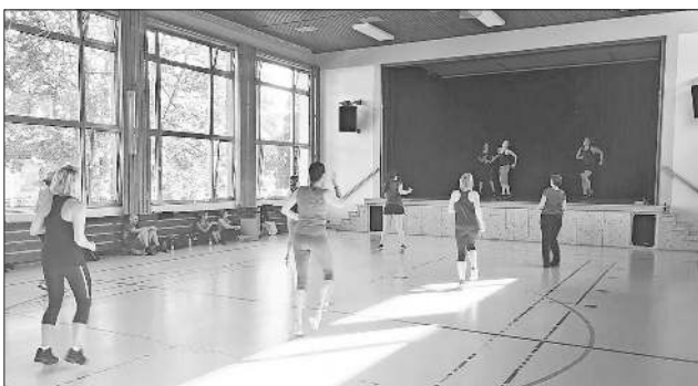
Im Zumba Rhythmus.