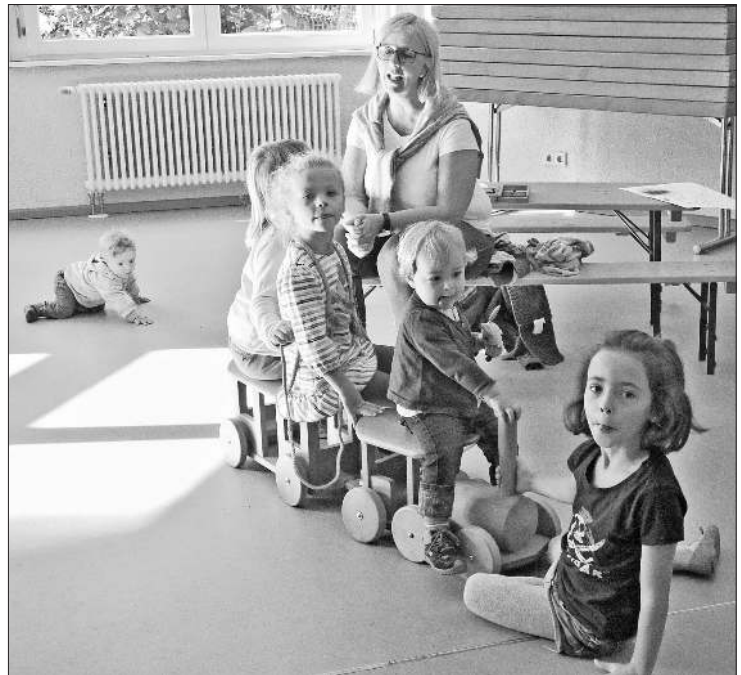
Eine Zukunft auch für die jüngsten Einwohner.

In Abhängigkeit der formulierten Leitthemen wurden entsprechende Projektgruppen gebildet. Diese sollten dann im