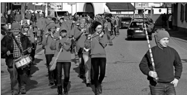
Wie immer, voran der Musik- und Spielmannszug der Feuerwehr Köndringen.

Mit großen Hallo empfangen: „Do hilft kei butze un kei schminge, ä Ruäbsäck muäß nach Ruäbe schdinge“, stand der imposant wirkende Baum bereits nach zehn Minuten, dank der vor drei Jahren neu installierten Aufstellhalterung. Damit ist das Aufstellen nicht nur wesentlich sicherer geworden, sondern auch wesentlich unkomplizierter. Alle waren erleichtert, als der Baum stand, und das wurde auch anschließend ein wenig gefeiert. Mittlerweile gehört das Narrenbaumstellen ebenso traditionell zur Köndringer Fasnacht wie der Narrenhock am Winzerhüs, der Kinderumzug und die Dorffasnacht am Fasnachts-Samstag.