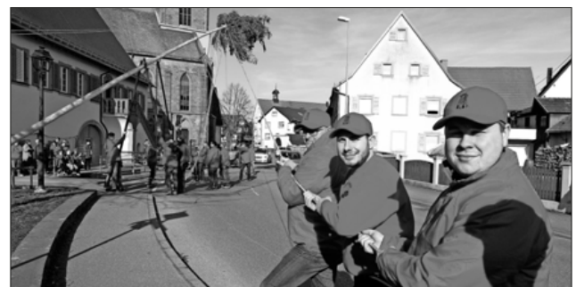
Aufgepasst, auf los gehts los!