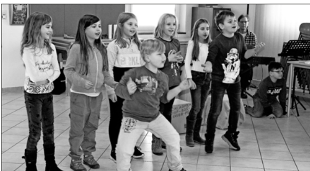
Die Schüler und Schülerinnen präsentierten eine stimmungsvolle Darbietung.

Die Dauerkooperation besteht in einer gemeinsamen Gestaltung des regulären Musikunterrichts der ersten bis zur dritten Klasse, der durch den Musiklehrer der Schule und einem Musiklehrer der Winzerkapelle Köndringen stattfindet. Dazu werden die Klassen in zwei Gruppen geteilt und parallel von Schule und Verein unterrichtet. Die dadurch ermöglichte Lehrerverdoppelung mit halber Klassengröße lässt auf beiden Seiten einen differenzierten Unterricht zu. Durch die ständige Zusammenarbeit lernen die Kinder schon frühzeitig den Verein nicht nur als Bildungseinrichtung kennen, sondern auch als eine sinnvolle Freizeitaktivität im außerschulischen Bereich. Und dass dies den Kindern sehr viel Spaß macht, war zweifelsfrei bei einigen ihrer musikalischen Kostproben bei der feierlichen Unterzeichnung der Kooperation zu spüren.