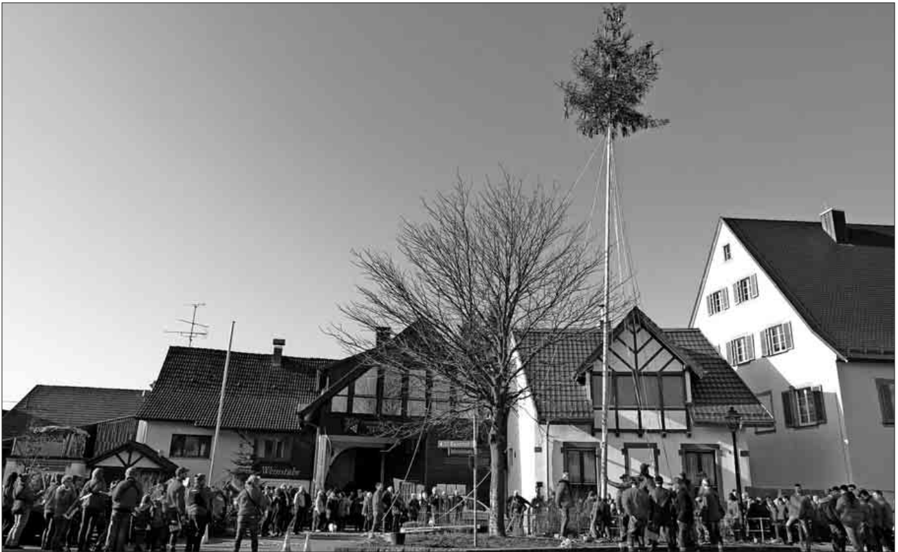
Es ist geschafft, „s goht degege“.