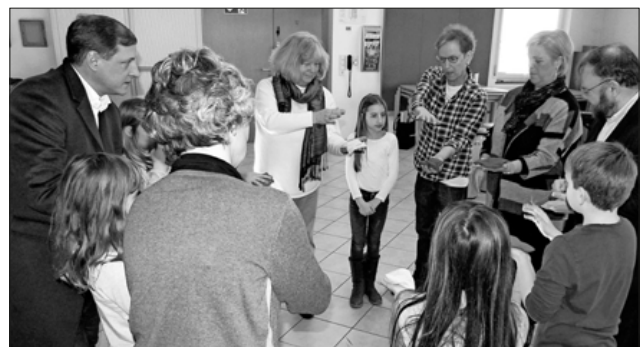
Auch die Gäste durften an einer rhythmischen Koordinationsübung teilnehmen.