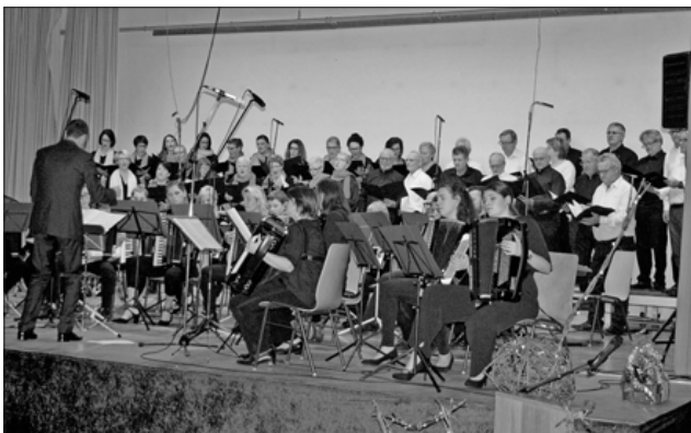
Gemeinsam unschlagbar: „Mix Dur“ und „Akkordeonisten“.