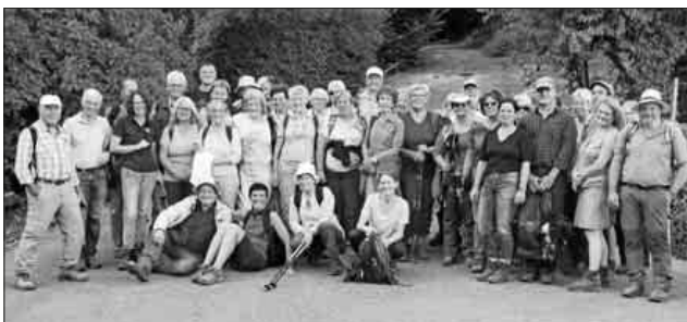
Die Wanderer bei ihrer Ankunft.

Gestärkt von einem elsässischen Vorspeisenteller ging die Wanderung über den alten Kreuzweg hinunter nach Gueberschwihr, das noch vielen alten Teninger Musikern in lebhafter Erinnerung sein müsste. Die Musik- und Feuerwehrkapelle hat dort öfters bei Weinfesten musiziert. Über den Jakobusweg, auf dem bereits die ersten Esskastanien lagen, mit stets schöner Aussicht, teils in den Reben, teils am Waldrand entlang, erreichte die Wandergruppe Vögtlinshoffen und schließlich das Weindorf Husseren am Fuße der sogenannten „drei Exen“ (Egisheimer Burgen). Das Ziel, das Hotel les Chateau, war erreicht. Unter der Wanderschar befand sich auch ein Wanderführer des Albvereines Friedingen mit seiner Frau. Er hatte die Wanderwoche der deutsch-französischen Wanderer aus Teningen und La Ravoire im Donautal organisiert. Sein Resümee: „Bei euch hat es mir gefallen, ich komme wieder einmal ...“. Es wurden insgesamt 11,8 Kilometer Wegstrecke in vier Stunden bei bester Laune bewältigt. Mit dem Bus fuhr man anschließend wieder nach Hause.