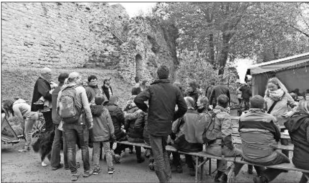
Gut besuchte Veranstaltung