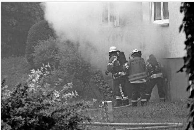
Der Löschangriff erfolgte von mehreren Seiten her.