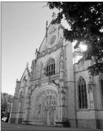
Königliches Klosters Brou

Zum diesjährigen Treffen, das jeweils abwechselnd einmal in Deutschland und im folgenden Jahr in Frankreich stattfindet, hatten die Freunde aus La Ravoire zum 14. bis 16. Mai nach Bourg-en-Bresse am Fuß des französischen Jura eingeladen. Am ersten Tag um die Mittagszeit erreichten die 15 Teilnehmerinnen und Teilnehmer aus Teningen das Hotel und wurden von den französischen Freunden in gewohnt französischer Herzlichkeit empfangen. Bei der anschließenden Besichtigung der Stadt war zu erfahren, dass diese von 1272 bis 1601 zum seinerzeit bedeutenden Herzogtum Savoyen gehörte, dessen Einflussbereich bis zum Mittelmeer reichte. Aus dieser Zeit stammen viele noch heute gut erhaltene Gebäude. Ein Höhepunkt bildete der anschließende Besuch der historischen Apotheke im „Hotel Dieu“, was zur damaligen Zeit ein Krankenhaus war, das heute als Altenpflegeheim dient. Die Apotheke ist noch im Originalzustand erhalten, bestehend aus einem „Labor“ mit großem Ofen und Destillierereinrichtung zum Zubereiten der Medikamente, die hauptsächlich auf der Basis von Kräutern hergestellt wurden. Der anschließende Raum, in dem auch die Bibliothek untergebracht war, diente als Lagerraum für die Medikamente, die in kunstvoll gefertigte Keramikgefäße abgefüllt wurden. Der Verkaufsraum mit Holzarbeiten im Stil Louis XV und Louis XVI war bestückt mit herrlichen Gefäßen aus Porzellan, Zinn und Glas aus der damaligen Zeit.