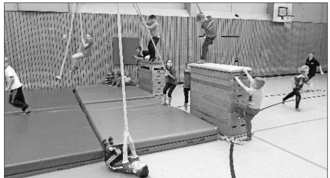
Fröhlich spielte man Tarzan in der Lechhalle.