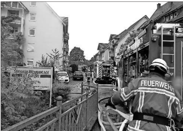
Die Feuerwehr war mit allen verfügbaren Fahrzeugen vor Ort.

Zwischenzeitlich hat ein Brandsachverständiger die Brandörtlichkeit untersucht. Es besteht der Verdacht der vorsätzlichen Brandstiftung, weshalb die weiteren Ermittlungen von der Kriminalpolizei Emmendingen übernommen wurden.