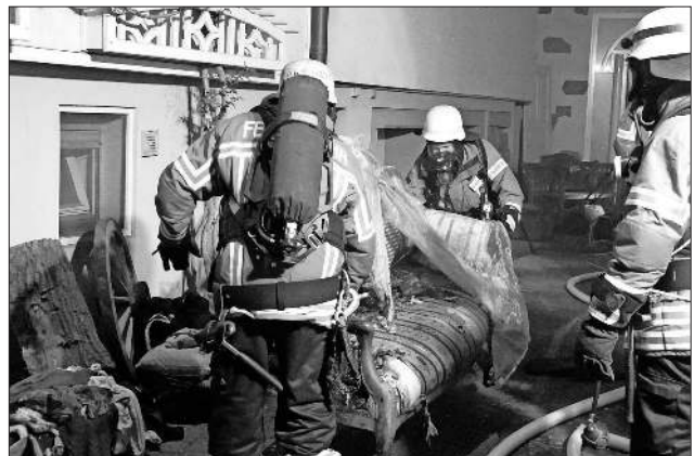
Zum Ablöschen wurde das Sofa herausgetragen.