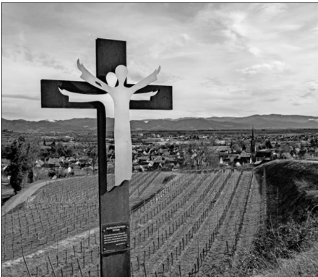
Das Auferstehungskreuz auf dem Hungerberg in Köndringen.