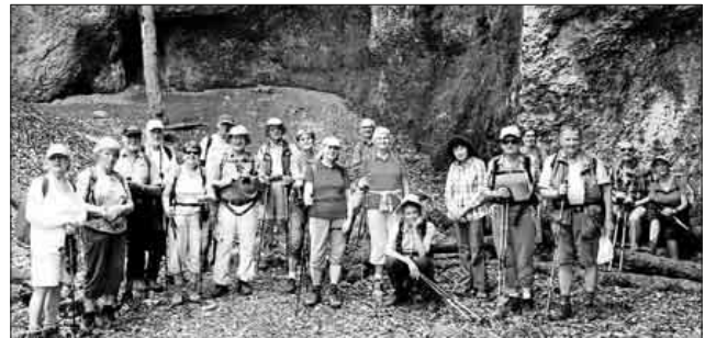
Die Gruppe in der Bronner Höhle.

Am nächsten Tag hieß es Abschied nehmen mit „au revoir“ im September bei den 35-jährigen Verschwiegerungsfeierlichkeiten in Teningen.