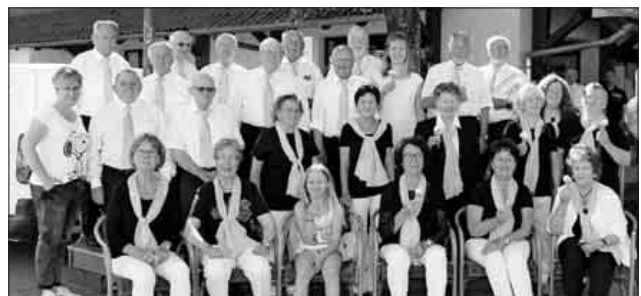
Die Sängerinnen und Sänger genießen den Sommertag.

Sängerinnen und Sänger sind immer herzlich willkommen , an einem Projekt zu einem Konzert mitzuwirken. Die nächste Aufführung ist zur Adventszeit, am 8. Dezember, in der evangelischen Kirche Teningen. Die Proben finden im evangelischen Gemeindehaus in Teningen statt, und zwar für den Gemischten Chor dienstags von 18.30 bis 20 Uhr und für Sing4fun donnerstags von 19 bis 20.30 Uhr. Ausführliche Informationen findet man auf der Homepage des Vereins unter gesangverein-teningen.de.