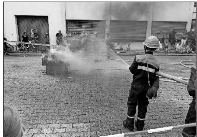
Die Jugendfeuerwehr demonstrierte einen Löschangriff.

So kamen die circa 5.000 Euro zusammen, die notwendig waren, das Fahrzeug wieder verkehrssicher zu machen. Die Idee entstand, weil es einigen zu schade war, das Stück Teninger Feuerwehrgeschichte eingemottet stehen zu lassen. Künftig wird das Fahrzeug bei diversen Festen oder Oldtimertreffs zu sehen sein. Natürlich war auch wieder bestens für das leibliche Wohl gesorgt und genauso wie der Fanfarenzug gehörte am Mittag auch der Spielmanns- und Musikzug der Feuerwehr Könndringen zum Unterhaltungsprogramm.