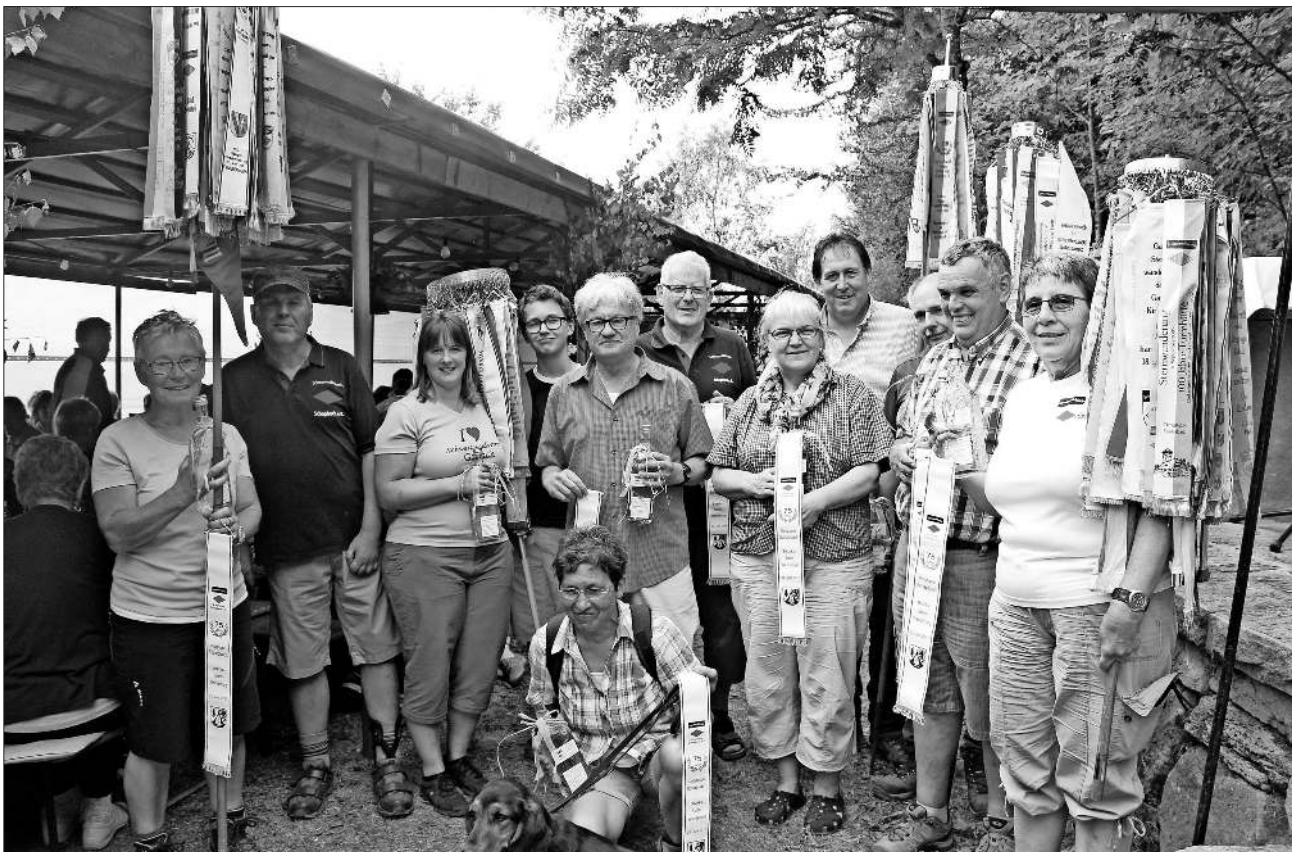
Wimpel und Gastgeschenk gab es für die Vertreter der Ortsgruppen im Schwarzwaldverein.

Alle anwesenden Ortsgruppen erhielten von den Schapbacher Vorsitzenden aus Anlass der Sternwanderung einen Wimpel mit der Aufschrift: Sternwanderung 2017, 75 Jahre Ortsgruppe Schapbach sowie als Gastgeschenk eine Flasche Schnaps mit Gravur. Die weitere Gestaltung des Nachmittags übernahm das Edelweiß-Echo aus Hardt, wobei die vier Musiker mit ihren Schlagern, neuen Hits und auch volkstümlicher Musik für eine gute Stimmung unter den Gästen im Festzelt sorgten.