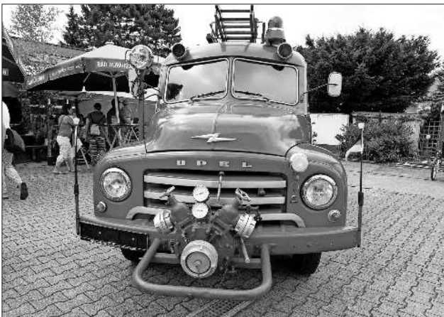
Er strahlt wieder, der Opel Blitz aus dem Jahr 1954.

Wie immer bildeten sich auch wieder lange Schlangen bei der Drehleiter, um aus luftiger Höhe auf Teningen schauen zu können. Ein weiterer Anziehungspunkt war ein Oldtimer-Feuerwehrrfahrzeug – ein Opel Blitz aus dem Jahr 1954. Das in die Jahre gekommene Einsatzfahrzeug stand die letzten Jahre seit der Außerdienststellung im Teninger „Wooghisl“. Im Januar hatten sich einige Feuerwehrkameraden vorgenommen, das Fahrzeug wieder TÜV-sicher zu machen sowie nach und nach Schön-