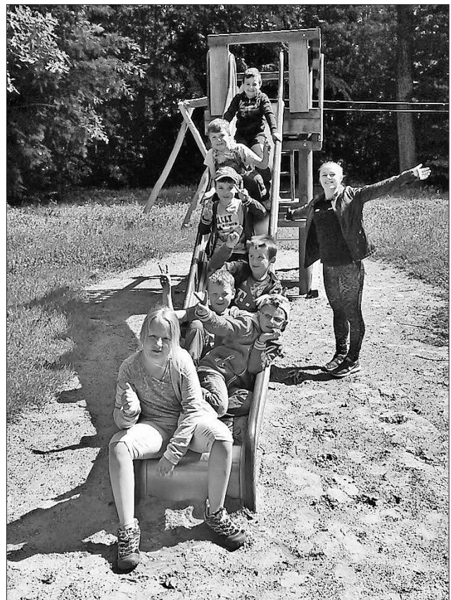
Auf dem Waldspielplatz.

Das nächste Ferienprogramm findet in den Sommerferien vom 28. August bis zum 8. September ebenfalls in und um die Tengerer Ludwig-Jahn-Halle statt. Für Rückfragen stehen die SpoFunnis-Mitarbeiter gerne zur Verfügung unter der E-Mail-Adresse spuero@spofunnis.de sowie 07641/9379999. Alle Infos auch unter www.spofunnis.de .