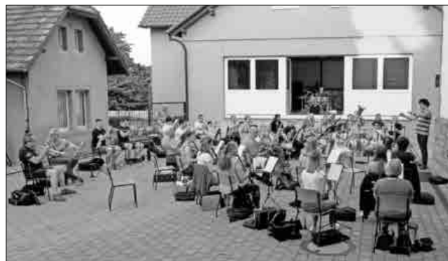
Die erste Probe der Winzerkapelle vor dem Haus der Musik.

Nach gut einem halben Jahr Pause waren Musiker und Dirigent bester Stimmung bei der ersten gemeinsamen Probe vor dem „Haus der Musik“. Obwohl die Musiker regelmäßig über das Internetprogramm „Jamulus“ probten, waren doch alle froh, endlich wieder gemeinsam zu proben. Eine Probe über das Internet ersetzt keinen gemeinsamen Auftritt.