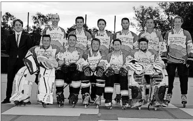
Ü32-Mannschaft Nimburg Crocodiles.

Aufgrund der relativ nahen Anreise in die Schweiz dürfen sich die Crocodiles über zahlreiche Unterstützer in der Halle vor Ort freuen. Wer nun Lust auf Inline-Skaterhockey bekommen hat, kann jedes Turnierspiel live über folgenden offiziellen Link des internationalen Verbandes verfolgen: http://www.topsniper.ch/web/index.php/news/coupes-d-europe/2374-toutes-les-videos-de-la-future-coupe-d-europe-seniors-live .