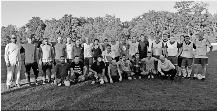
Gruppenfoto aller Spieler.