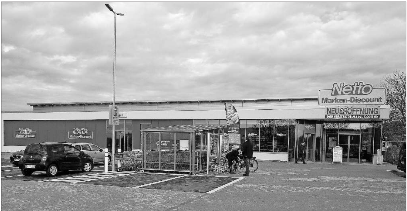
Der Netto-Markt in Nimburg bietet mit 4.500 Artikeln alle Lebensmittel für den täglichen Bedarf an.