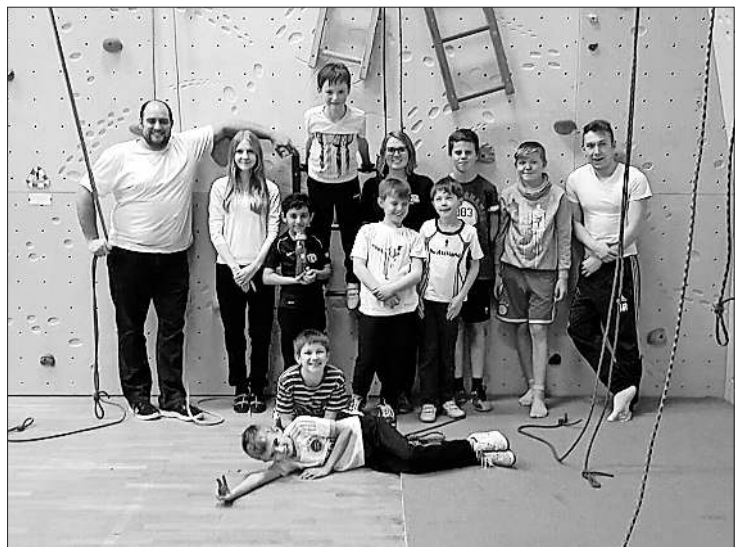
Hoch hinaus ging es in der Ferienaktion des Kinder- und Jugendbüros für alle Teilnehmer.

Am letzten Mittwoch machten sich acht abenteuerlustige und mutige Kinder von Teningen aus auf den Weg, um die steilen Wände der „Emmendinger Berge“ zu erklimmen. Um für die anspruchsvollen Touren gewappnet zu sein, wurde vorab im „ImPulsiv“ in Emmendingen hart trainiert. Ausgestattet mit Gurt und Karabiner wurde unter der Anleitung der Mitarbeiter des KJB und zweier Mitglieder des Jugendtreffs Teningen der Ernstfall geprobt. So manch einer kam dabei ordentlich ins Schwitzen. Abgestürzt aufgrund von feuchten Händen ist jedoch keiner. Die ganz Mutigen konnten Geschick, Ausdauer und Muskelkraft neben einem Balanceakt auf der Slackline auch an der Boulderwand, völlig ohne Sicherungsseil, unter Beweis stellen. Nach zwei Stunden voller Action und Anstrengung an den zum Teil über 17 Meter hohen Kletterwänden waren alle Teilnehmer zufrieden und glücklich über den erbrachten Mut und konnten stolz auf ihre Leistungen sein. Aufgrund der großen Nachfrage wird das KJB diese Veranstaltung in naher Zukunft wiederholen.