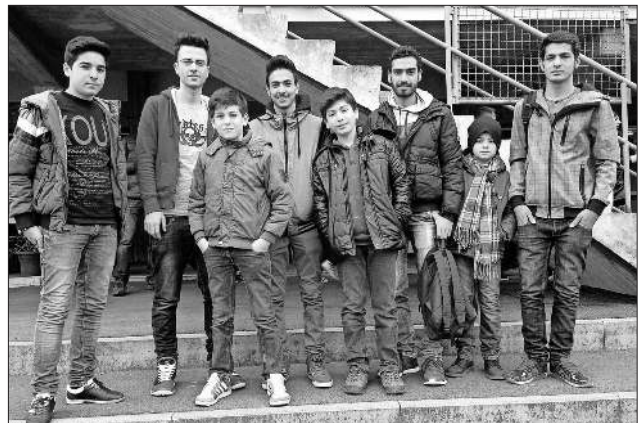
Die Teilnehmer beim Länderspiel.

Zu diesem Anlass fuhren ehrenamtliche Helfer mit Teningen jugendlichen Flüchtlingen sowie das Kinder- und Jugendbüro mit Flüchtlingen aus Nimburg und Böttingen nach Freiburg, um die deutsche U20-Nationalmannschaft anzufeuern. Mit mehr als 4.000 Zuschauern war das Stadion gut besucht und vermittelte den jungen Flüchtlingen, die teilweise zum ersten Mal in einem Stadion waren, einen guten Eindruck von einem Länderspiel. Beim 1:0 für Deutschland feierten alle mit und freuten sich für die deutsche Mannschaft. Auch wenn das Spiel am Ende unentschieden ausging, war es dennoch ein gelungener Nachmittag für alle.