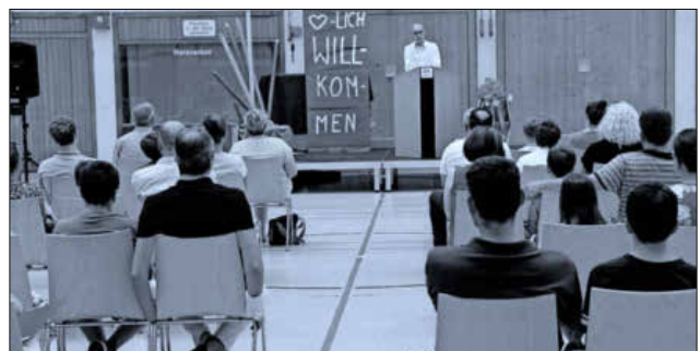
Die Schülerinnen und Schüler der kommenden Klasse 5e werden eingeschult.