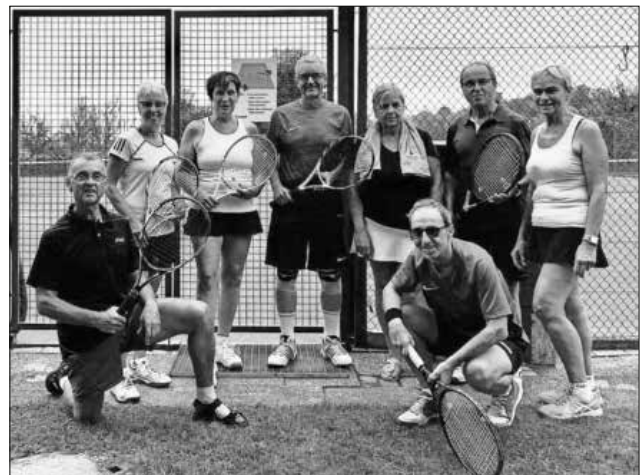
Mixed-Team 50er Heimbach.

Ganz anders sieht die Lage bei der Mixed 1 aus! Da würde ein Sieg gegen Hochdorf die Tabellen-Führung bedeuten. Das letzte Heimspiel des Mixed-Teams hat also einen besonderen Charakter und wird für alle beteiligten Mannschaften höchst spannend werden, denn der Gewinner der Partie ist dann auch Tabellenführer!