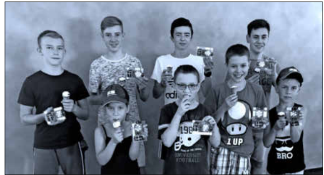
Die fleißigen Ferienspaßkinder wurden von der Firma Kopfmann Elektrotechnik mit leckerem Eis belohnt.

Das KJB Team hofft, dass baldmöglichst wieder in den gewohnten „Ferienbetrieb“ übergegangen werden kann und im nächsten Sommer wieder ein kunterbuntes Ferienspaßprogramm 2021 auf alle Teningen Kinder und Jugendlichen wartet.