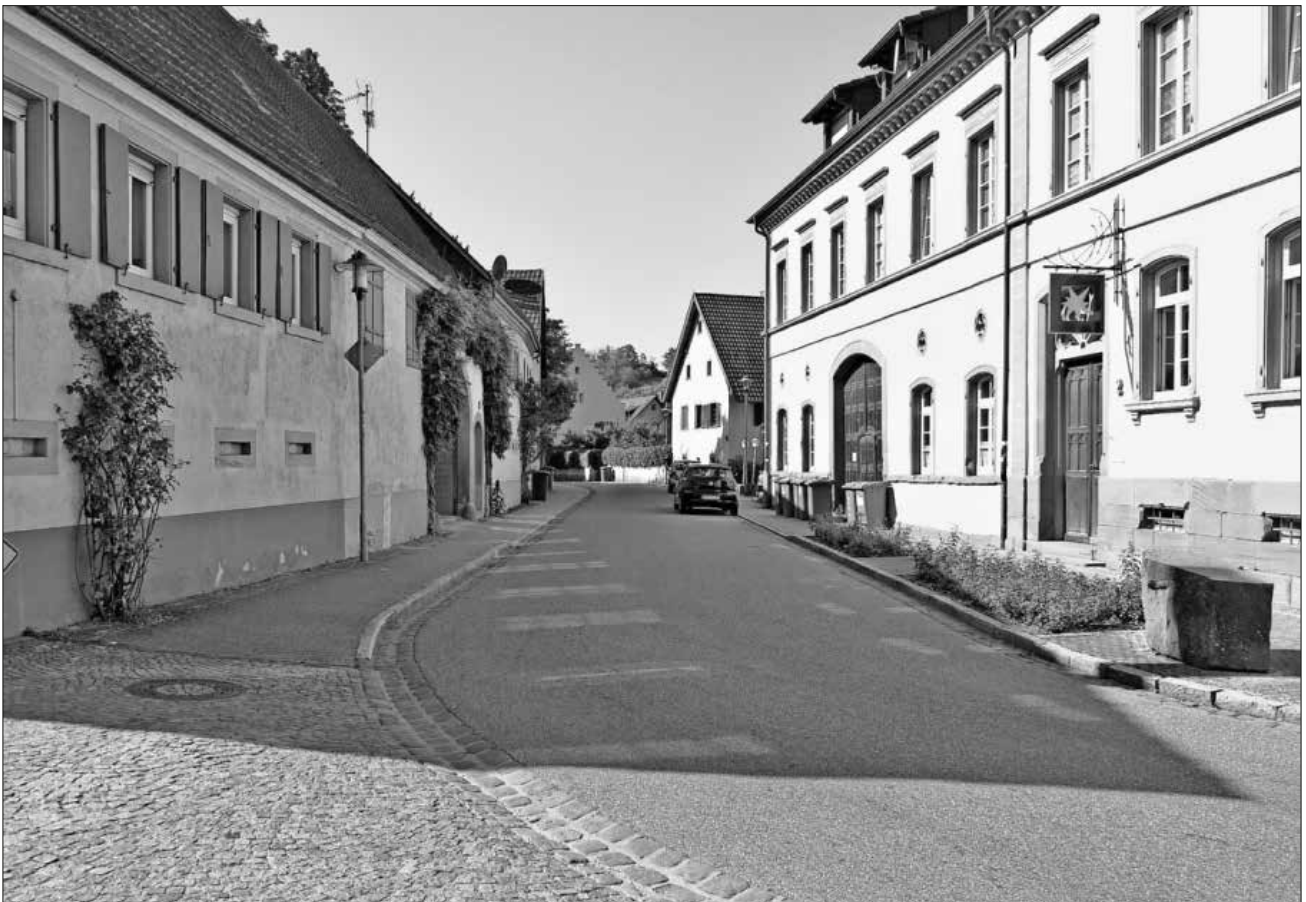
Der Niederbordsteinbereich reicht in der Köndringer Straße vom Schloss bis gegenüber zum „Sternen“. Hier ist Parken grundsätzlich verboten.

Die nächste Sitzung des Ausschusses Leitbild findet am morgigen Donnerstag, 24. September, statt.