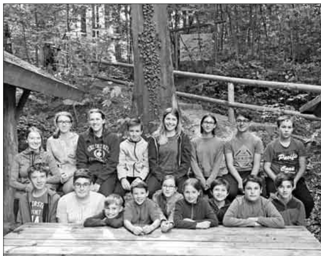
Die Kinder hatten viel Spaß beim Ausflug in den Kletterwald.

Alle waren sich einig: Es hat sehr viel Spaß gemacht! Und so freuen sie sich schon wieder auf das nächste Mal. Ein großes Dankeschön an die Jugendleiterinnen und alle Fahrer!