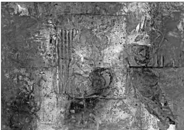
Eines der Ausstellungsstücke, das bei der Vernissage gezeigt wird.

Die Ausstellung ist bis Sonntag, 2. Dezember, immer sonntags von 14 bis 17 Uhr und nach Vereinbarung (E-Mail: rebay-foererverein@t-online.de) geöffnet.