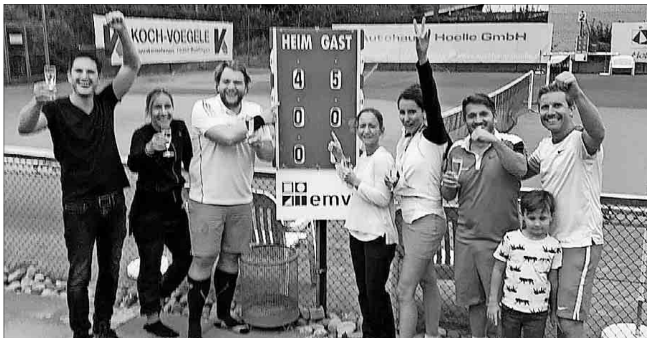
Die Mixed-I-Mannschaft nach ihrem Sieg gegen den TC Bahlingen.

Letztlich Punktgleich mit dem Gruppenersten entschieden die Spielergebnisse der laufenden Runde, weshalb es hier wie schon bei den Herren 40 hauchdünn leider nicht für die Meisterschaft gereicht hat.