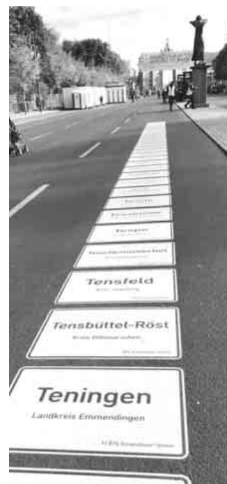
Band der Einheit in Berlin 2018.