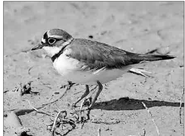
Der Flussregenpfeifer.

Die Gemeinde Teningen und das Regierungspräsidium Freiburg bitten die Besucher der Elz dringend, das Betretungsverbot der Kiesbänke bis zum Ende der Brutzeit Ende Juli einzuhalten und damit einen wichtigen Beitrag zum Schutz dieser so seltenen Vögel zu leisten.