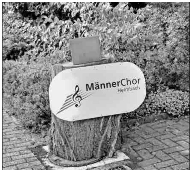
Anmelde-Briefkasten beim Anwesen Rinklin, Teningen-Heimbach, Dreibrunnenstraße 6.

In diesen schwierigen Zeiten zusammenhalten und gegenseitig unterstützen. Für die Unterstützung im Voraus schon ganz herzlichen Dank. Einblicke und Infos über die Aktivitäten des Chores auch unter www.Maennerchor-Heimbach.de .