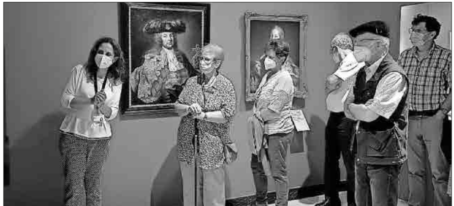
Interessierte Teilnehmer bei der Führung.