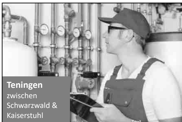
Teningen zwischen Schwarzwald & Kaiserstuhl

Um die Veranstaltungen besser planen zu können, wird um eine Anmeldung innerhalb der angegebenen Fristen gebeten. Alle Veranstaltungen finden nach den allgemein geltenden Vorgaben der Regelungen und Verordnungen im Sinne des Infektionsschutzes statt. Eine etwaige Absage der Veranstaltungen kann kurzfristig erfolgen.