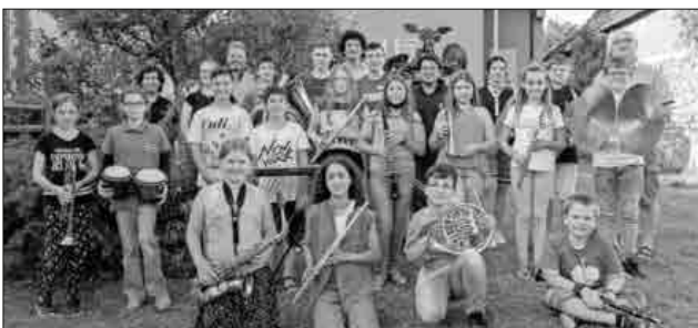
Bläserjugend der Winzerkapelle Köndringen.

Hierzu sind natürlich alle Eltern, Geschwister, Omas, Opas, Tanten, Onkels oder Freunde herzlich eingeladen. Für Speis und Trank wird bestens gesorgt sein. Es gelten die tagesaktuellen Coronabestimmungen. Deshalb wird vor Ort die Möglichkeit geboten, über eine handschriftliche Liste, die Corona-Warn-App oder die Luca-App beim Vorspiel dabeizusein.