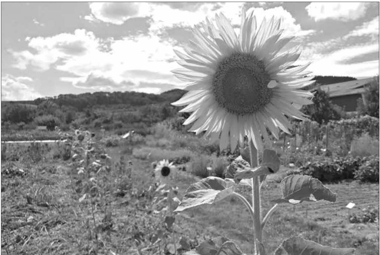
Malerischer Blick auf den Kaiserstuhl.

Im „Café Mitnander“ konnten sich anschließend alle bei Kaffee und Kuchen oder einem kühlen Getränk stärken und verwöhnen lassen.