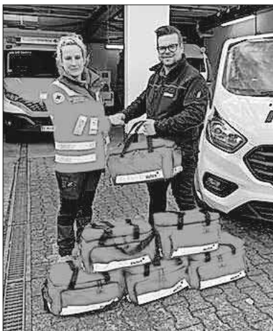
Große Freude bei der Übergabe der Notfalltaschen.

Die HvO sind weiter auf Spenden angewiesen, um ein geeignetes Fahrzeug finanzieren zu können und bitten daher um Unterstützung des aktuellen Crowdfunding. Infos unter www.viele-schaffen-mehr.de/projekte/leben-retten-in-teningen-hvo .