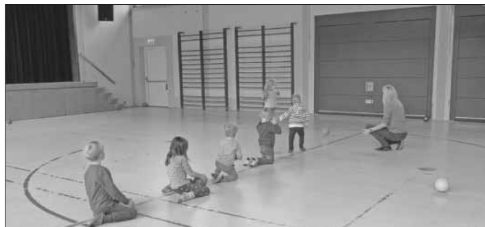
Bewegungsspiele in der Anton-Götz-Halle.