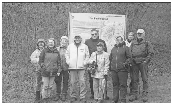
Die Wandergruppe am Badloch in Oberbergen.

Über den Badenbergrund um Oberrottweil wanderte die kleine Wanderschar, trotz vorausgesagtem, aber nicht eingetretten schlechten Wetter, immer am Krottenbach, der einmal 13 Getreidemühlen angetrieben hat, entlang nach Oberbergen. Durch den Ort und am sanierungsbedürftigen Rückhaltebecken vorbei ging es am Fuße des Badberges entlang bis zum Badloch, wo ein zünftiges Rucksackvesper eingenommen wurde. Frisch gestärkt gelangte man nach Altvogtsburg und schließlich im Aufstieg zum Altvogtsburger Kreuz und über die Degenmatten zur Robert-Meier-Hütte. Der Abstieg nach Eichstetten führte über den Fohrenbuck, das Atrium und den langen Altweg zur wohlverdienten Einkehr in ein Café in Eichstetten und anschließend an der alten Dreisam entlang zurück zum Bahnhof Nimburg, wo man zufrieden feststellen durfte, an diesem Tag 17 Kilometer auf einem der schönsten Themenpfade bewältigt zu haben.