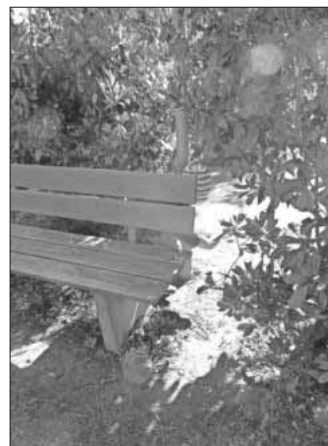
Suche nach dem Osternest.

Anfang des Monats hörten die Kinder mit dem Kamishibai-Theater von Jesus und Ostern. Beim gemeinsamen Osterfrühstück mit Traubensaft wurde dem letzten Abendmahl von Jesus und seinen Freunden gedacht. Bei einem kleinen Ostergebet wurde daran erinnert, wie Jesus zu seinen Freunden sagte: „Wenn ihr zusammensitzt und gemeinsam esst und trinkt und dabei an mich denkt, dann ist es, als wäre ich bei euch!“. Mit der leuchtenden Jesuskerze in der Mitte war Jesus Teil des Osterfrühstücks im Kindergarten.