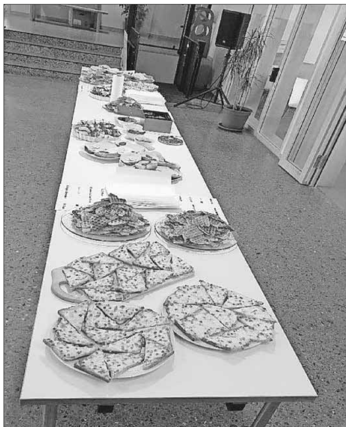
Das selbst zubereitete Frühstücksbüfett mit vielen Leckereien.

Das Frühstücksbüfett hat allen sichtlich gut geschmeckt und wird in den kommenden Monaten sicher noch mehrfach wiederholt werden.